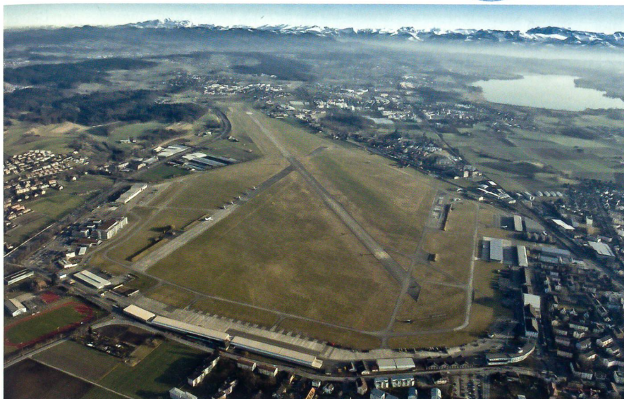
Seite 29: Dübendorf muss Militärflugplatz bleiben.