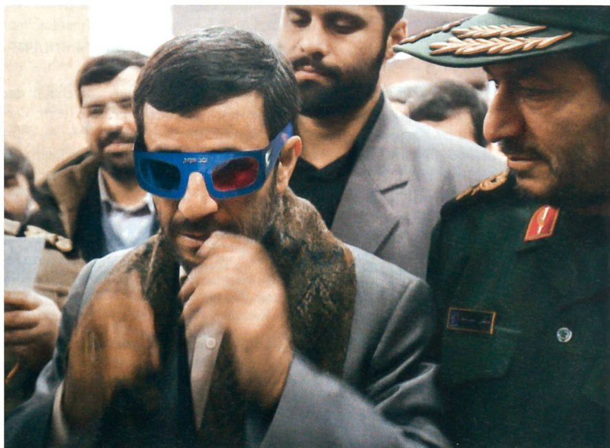
Präsident Ahmadinejad mit Offizieren in einem Forschungszentrum in der Nähe von Teheran. Er trägt eine spezielle Brille, um eine Computer-Simulation des iranischen Raketenprogramms genau betrachten zu können.

Wieder einmal hatte die iranische Führung den Westen brüskiert. Dann kam die offizielle Absage. Und Präsident Ahmadi-