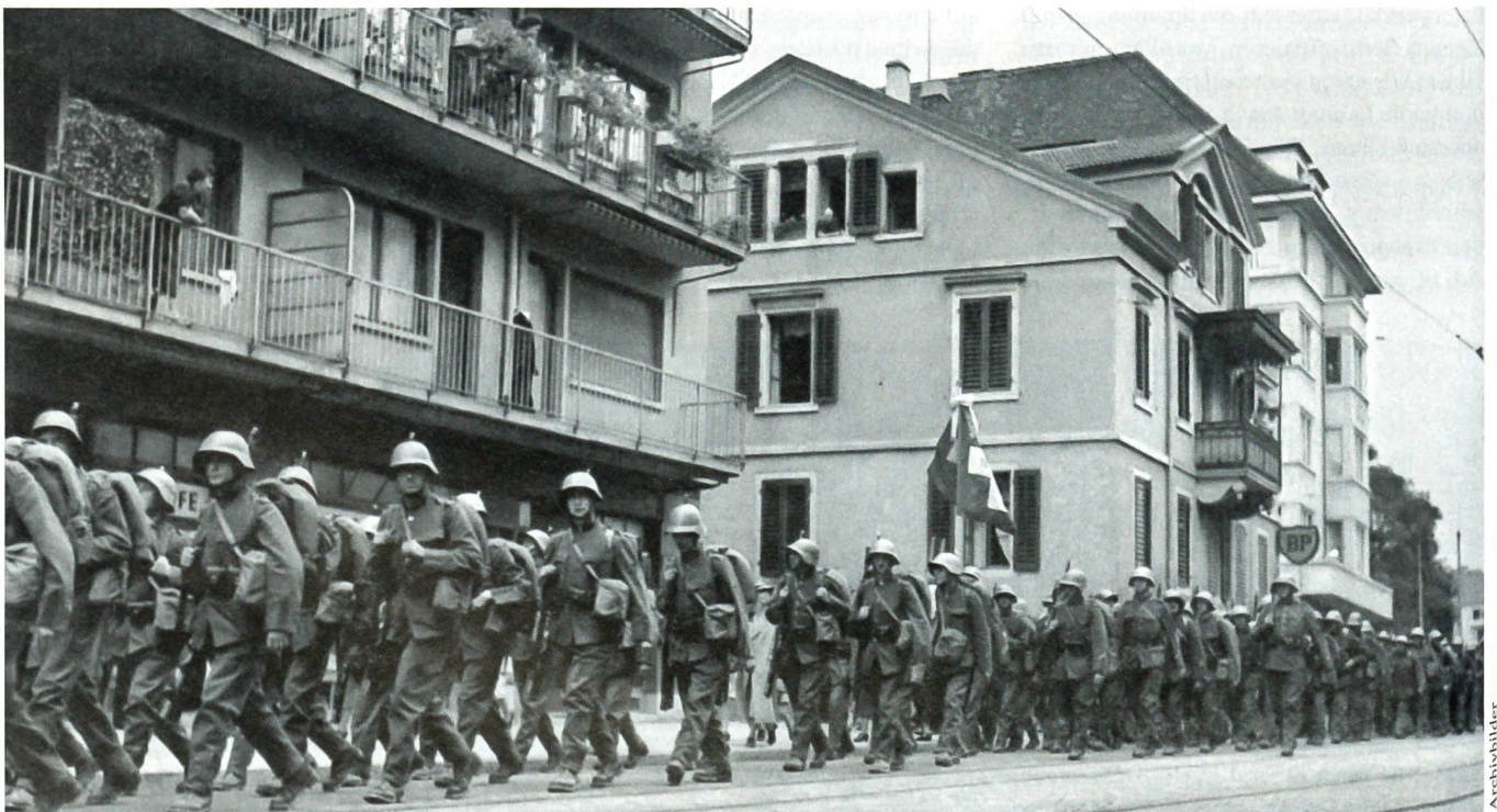
Mobilmachung am 2. September 1939: Marsch durch Zürich.

Ab 8 Uhr morgens des 2. September 1939 (es war der erste Mobilmachungstag) füllte sich das Schulhausareal in Wollishofen mit Hunderten von Wehrmännern. Unsere ganze Einheit, das Geb S Bat 10, stellte sich ein. Im Laufe des Tages wurden wir vereidigt. Eine Nacht brachten wir, alle fünf