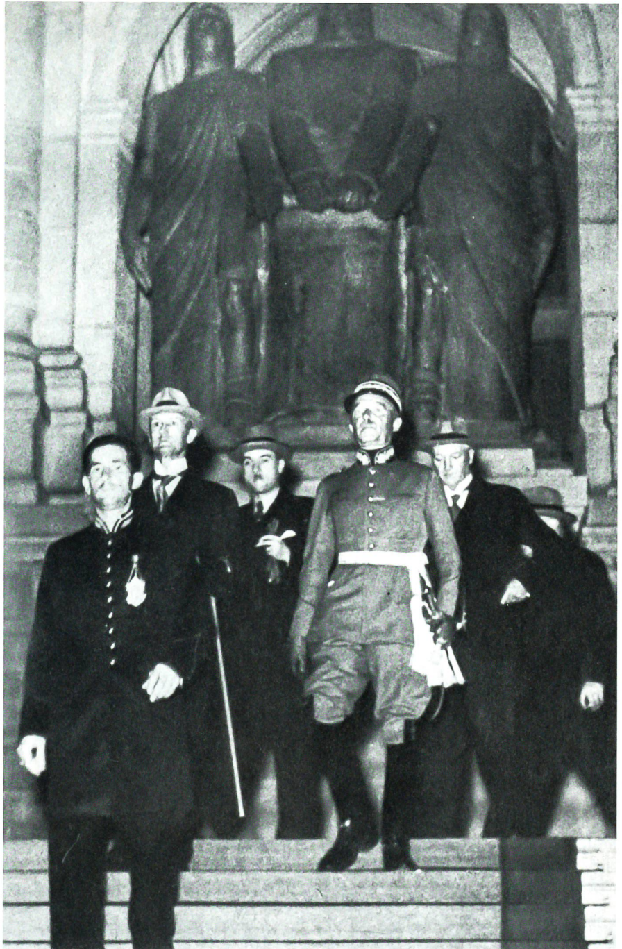
Henri Guisan nach der Wahl zum Oberbefehlshaber in Begleitung der Bundesräte auf der Innentreppe des Bundeshauses. 30. August 1939.

Aber schon hiess es wieder einsteigen. Die Bahnfahrt ging nun weiter Reusstal auf-