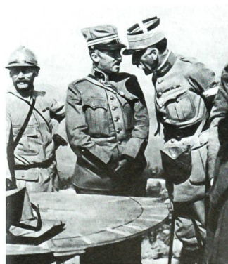
Oberstleutnant Guisan mit einem französischen Offizier an der Front von Verdun 1916.