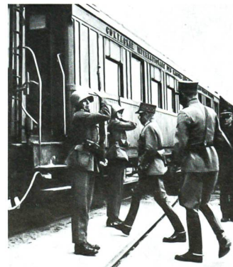
In Interlaken besteigt General Henri Guisan seinen Kommando-Eisenbahnzug.