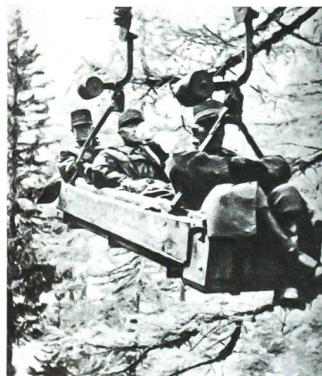
Bedretto: Vorne Oberst Luchsinger, Mitte Guisan, hinten Generalstabschef Huber.

Im Gegensatz zu Ulrich Wille, dem General während des Ersten Weltkriegs, war Guisan in der Schweiz unumstritten. Am 12. April 1960 säumten in Lausanne 300 000 Personen, darunter viele Veteranen des Aktivdienstes in Uniform, den Weg seines Begräbniszugs. +