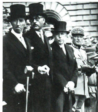
Fahnenmehrung 19. August 1945: Die Bundesräte Celio, Kobelt, von Steiger, General Guisan.