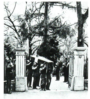
12. April 1960: Wehrmänner tragen den Sarg des Generals aus dem Tor von Verte Rive.