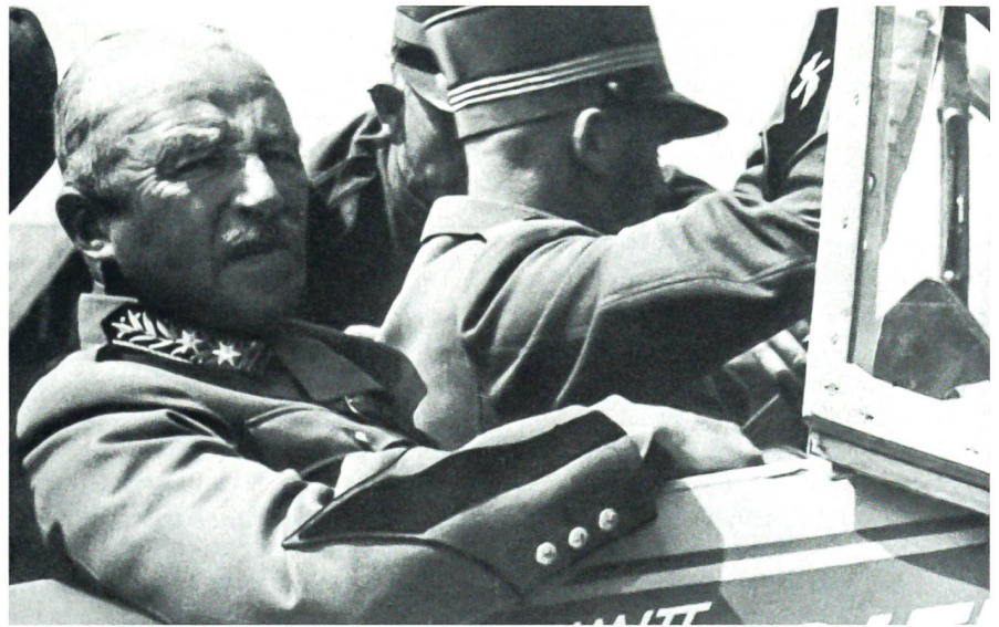
General Henri Guisan bei den Fliegern: Im Cockpit einer Messerschmitt «Taifun».

1916 wurde er Oberstleutnant im Generalstab in der Operationsabteilung in Bern, 1919 Generalstabschef der 2. Division sowie gleichzeitig Kommandant des Infanterieregiments 9, mit dem er im gleichen