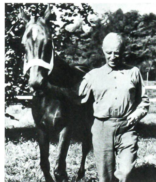
Henri Guisan nach seinem Rücktritt zurück auf dem Lande mit dem Pferd «Nobs».