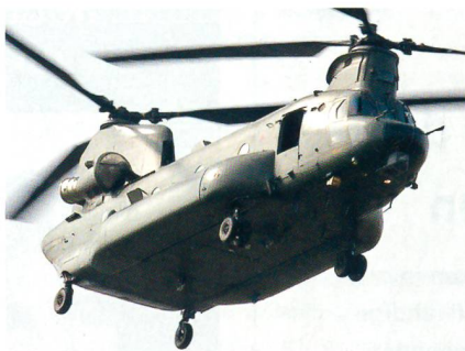
Schwerer Transporthelikopter Chinook der britischen Streitkräfte.

Das britische Verteidigungsministerium hat bekanntgegeben, dass es die schweren Transporthelikopter des Typs Boeing Chinook HC.2/2A/3 kampfwertsteigern will. Die Verbesserungen beinhalten die Integration eines neuen digitalen Cockpits sowie den Einbau von leistungsstärkeren Triebwerken des Herstellers Honeywell. Die Kampfwertsteige-