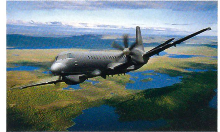
Saab 2000 Airtracer.

Das schwedische Unternehmen Saab Surveillance Systems hat auf Basis des Propellerflugzeuges Saab 2000 die neue Airtracer-SIGINT-Plattform vorgestellt. Dieses strategische elektronische Aufklärungssystem beinhaltet sowohl elektronische Aufklärung, Funkaufklärung und elektronische Unterstützung sowie ein C3-Führungssystem und ein System zur elektronischen