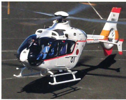
Japanischer EC 135 T2i.

Eurocopter Japan hat der Seestreitmacht der japanischen Selbstverteidigungsstreitkräfte den ersten Schulungshelikopter vom Typ EC135 T2i übergeben. Japans Verteidigungsministerium hatte im Februar dieses Jahres einen Auftrag über zwei EC135-Helikopter unterzeichnet. In einigen Monaten soll ein zweiter Auftrag über drei weitere Helikopter folgen, wobei Japans Marine den Aufbau einer Flotte von insgesamt 15 Schulungshelikoptern plant. In Europa werden die EC135 oder deren Militärversion EC635 bereits in Deutschland, der Schweiz und