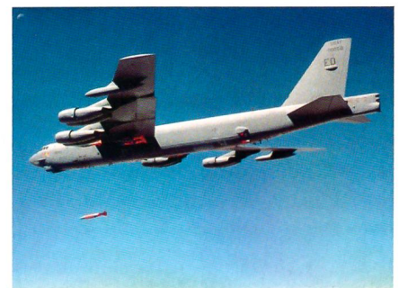
B-52H beim Testabschuss von JDAM-Präzisionswaffen.

Die US Air Force hat Boeing damit beauftragt neue Kommunikationsmittel im EHF-Frequenzbereich (Extremely High-Frequency) in die Flotte des strategischen Bombers B-52H zu integrieren. Diese Auf-