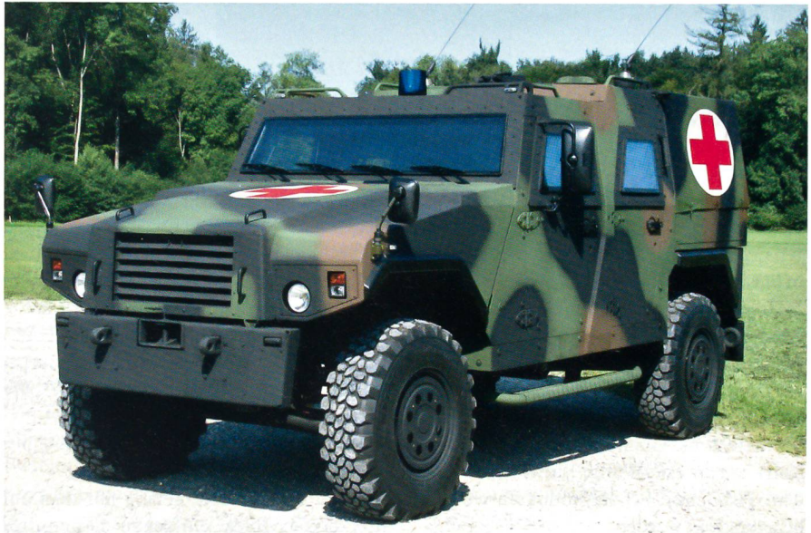
Der Eagle IV BAT (Beweglicher Arzt-Trupp) für die Rettungskette in Afghanistan.

Verwundeten unter Schutz (wie in einem Patrouillen- oder Gefechtsfahrzeug) sicherzustellen.