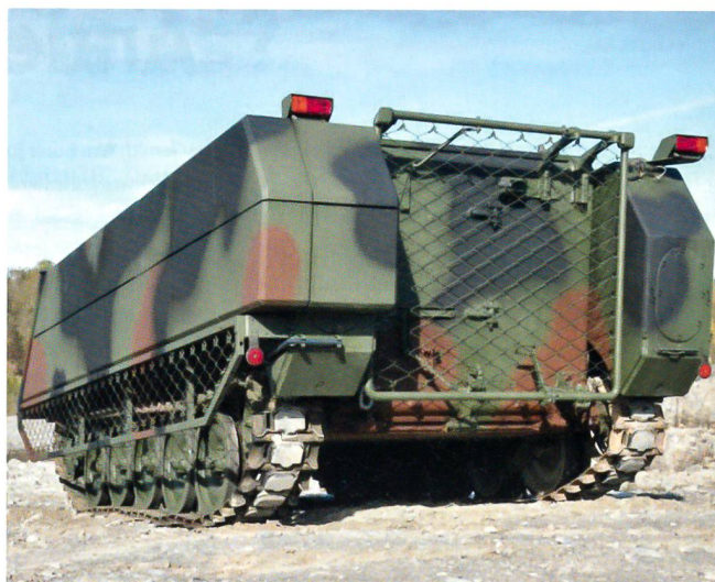
Hier sieht man die Möglichkeiten des Kunden in der Montage von SidePRO-LASSO und SidePRO-RPG am Schützenpanzer.