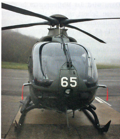
Der EC635 komplettiert die Heli-Flotte.

Der letzte der 20 EC635-Helikopter ist endmontiert. Am 17. Dezember 2009 hat die Armasuisse in Alpnach/OW den letzten der 20 neuen EC635-Helikopter der Luftwaffe übergeben.