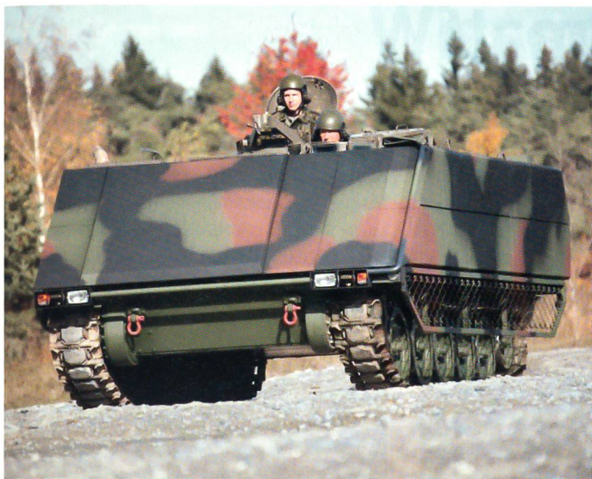
Ein vollständig mit SidePRO-RPG und SidePRO-LASSO ausgerüsteter Schützenpanzer.