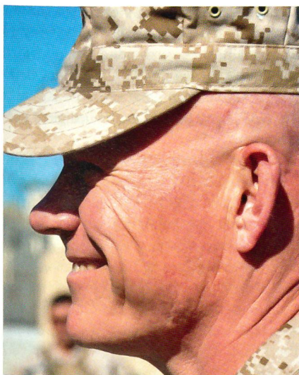
Brigadegeneral Larry Nicholson führt die «Task Force Leatherneck» (2nd Marine Expeditionary Brigade) mit ihren rund 16 000 Marines in der Südprovinz Helmand, Afghanistan, gegen die Taliban.

Neben den Marines der 2nd MEB stehen gegenwärtig folgende Verbände des Heeres im Einsatz: Verbände der 82. Luftlande-Division, der 4. Infanterie-Division (Mech), der 10. Gebirgs-Division und der 25. Infanterie-Division. Diese werden durch eine Vielzahl von weiteren Unterstützungs- und Logistikformationen, unter