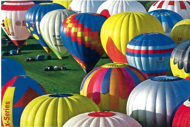
Freude herrscht: Ballone am Start.