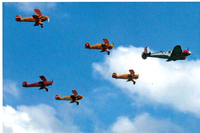
Pioniere der Luftfahrt: Die Wimmer-Bü-Staffel.