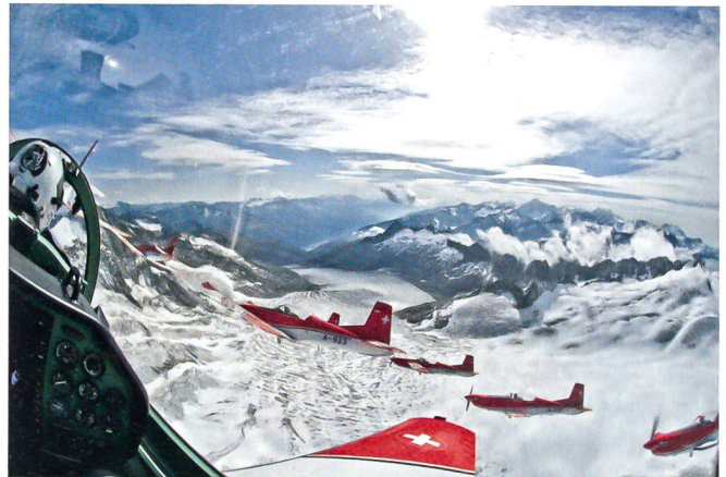
Eine Visitenkarte: Das PC-7-Team im Jahr 2008.