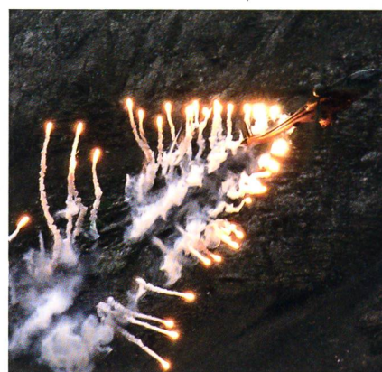
Cougar stösst Flares aus.