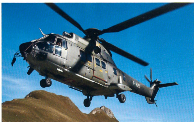
Der ältere Transporthelikopter Super-Puma.