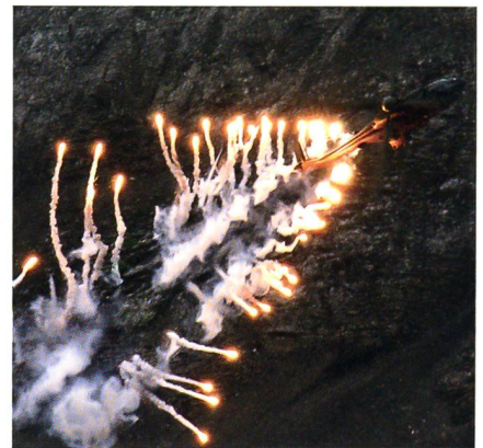
Cougar stösst Flares aus.