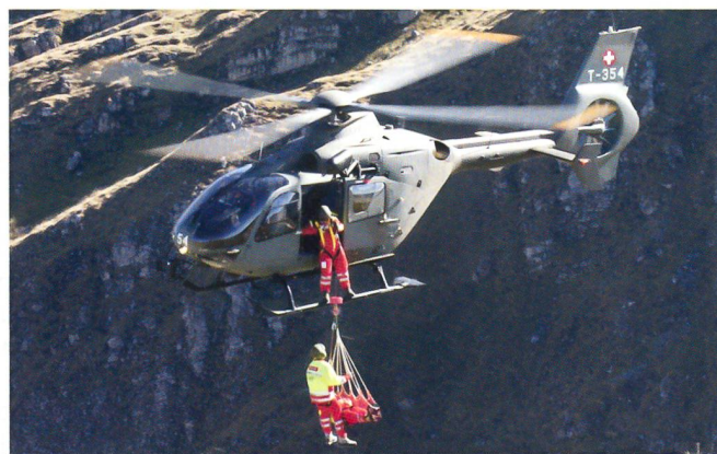
Rettungsdemonstration mit dem EC-635.