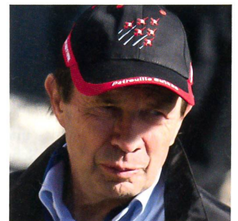
Ein stiller Geniesser: Ex-Nationalrat Franz Steinegger.