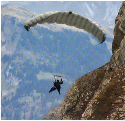
Fallschirmaufklärer nahe am Fels.