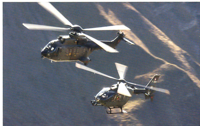
Der Cougar mit dem neuen EC-635.