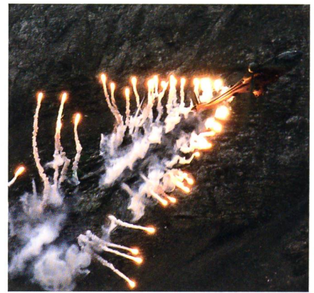
Cougar stösst Flares aus.