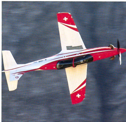
Der Schulung dient der PC-21.