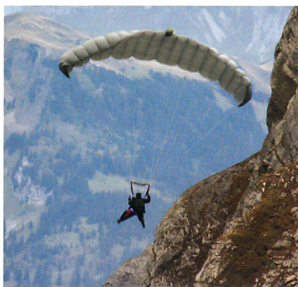
Fallschirmaufklärer nahe am Fels.

Die Patrouille Suisse mit ihren rot-weissen Tigern ist und bleibt die Visitenkarte unserer Armee.