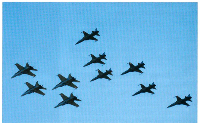
Am Himmel über dem Berner Oberland: F/A-18 und F-5.