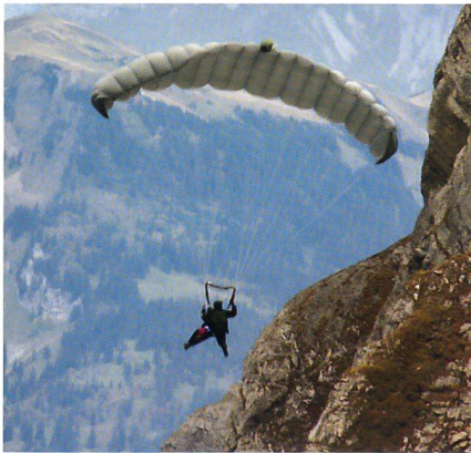
Fallschirmaufklärer nahe am Fels.