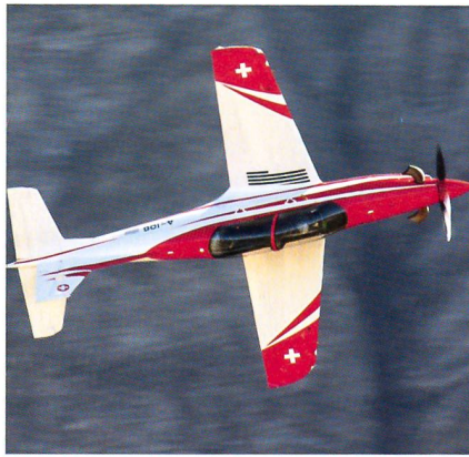
Der Schulung dient der PC-21.