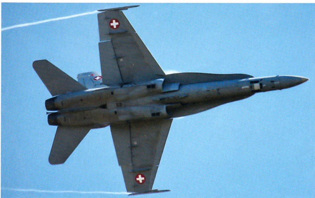
Der F/A-18, der Stolz unserer Luftwaffe.