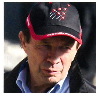
Ein stiller Geniesser: Ex-Nationalrat Franz Steinegger.