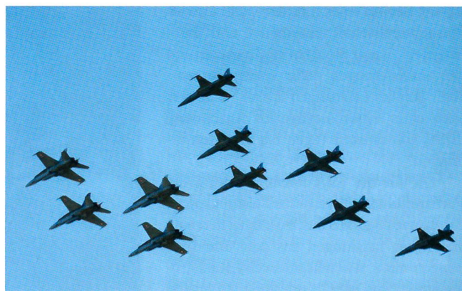
Am Himmel über dem Berner Oberland: F/A-18 und F-5.