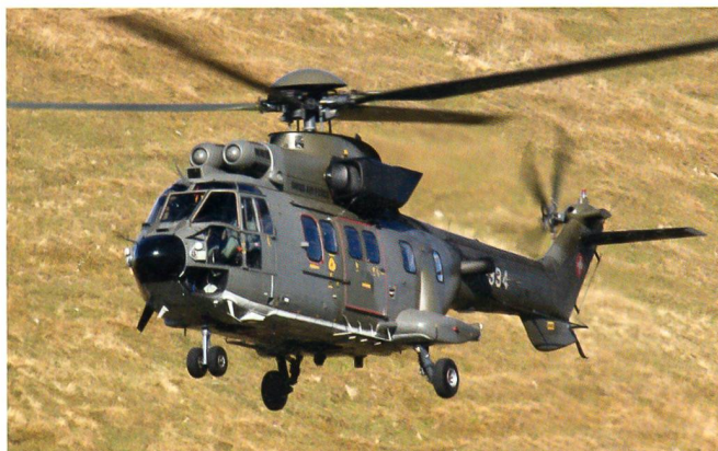
Das neuere Modell ist der Cougar.