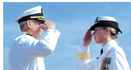
Amerikanische Marine: Meilensteine für die Frauen