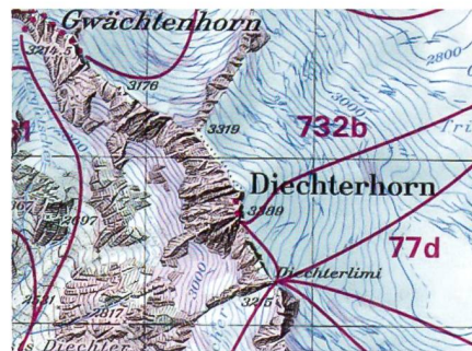
Neue Skitourenkarte: Das Diechterhorn.

Es freut das Bundesamt für Landestopographie (Swisstopo), den Leserinnen und Lesern des SCHWEIZER SOLDAT ganz neue Skitourenkarten vorzustellen. Diese neuen Karten enthalten viele wertvolle Informa-