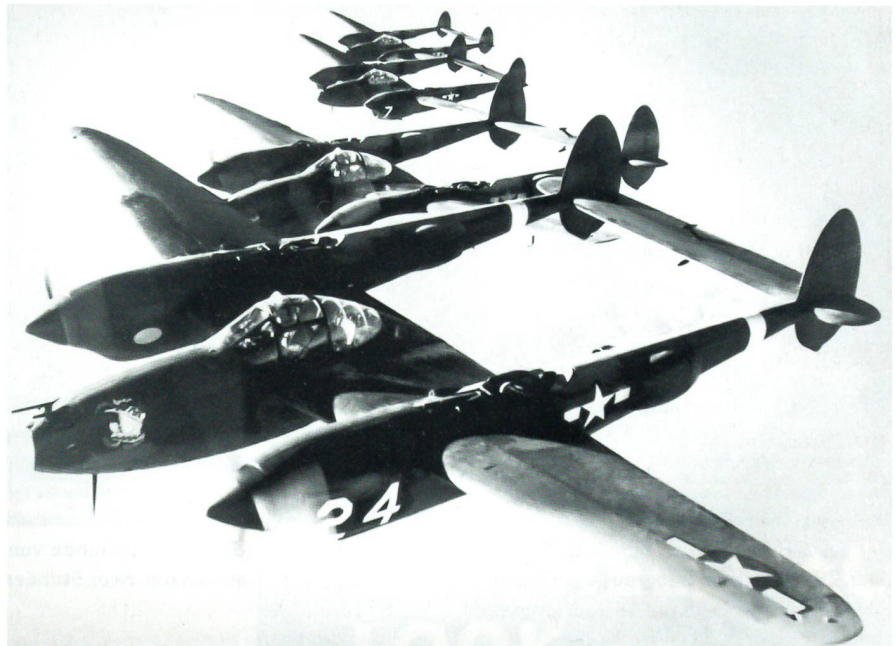
Die Japaner nannten die P-38 «flüsternder Tod» die Deutschen «Gabelschwanzteufel».