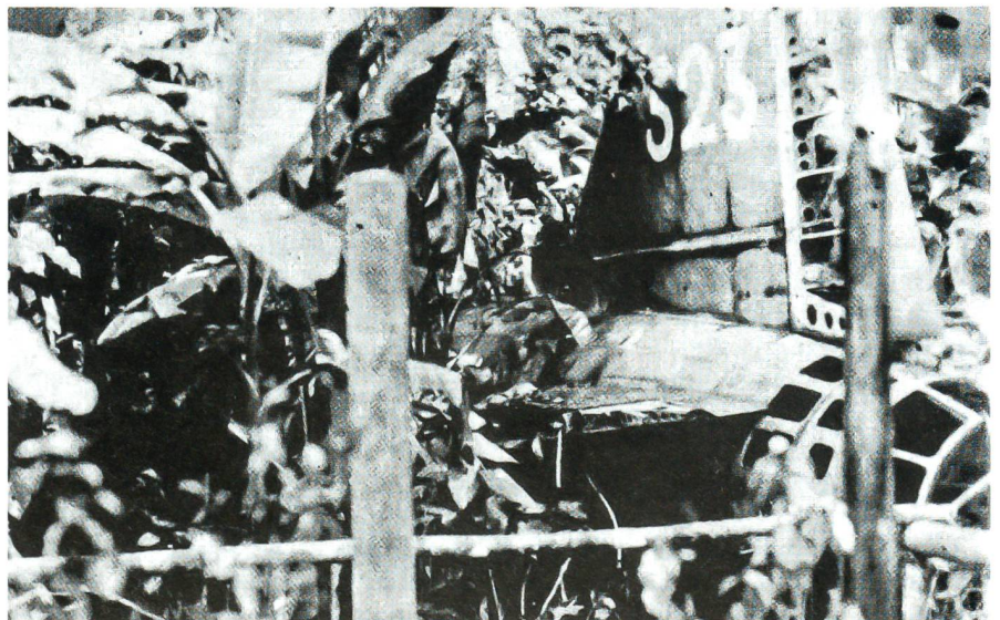
Leicht unscharfes Bild aus dem Krieg: Die abgestürzte Betty im Dschungel.