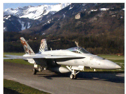
Der unverwüsthliche F/A-18 Hornet.