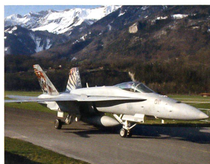
Der unverwüsthliche F/A-18 Hornet.