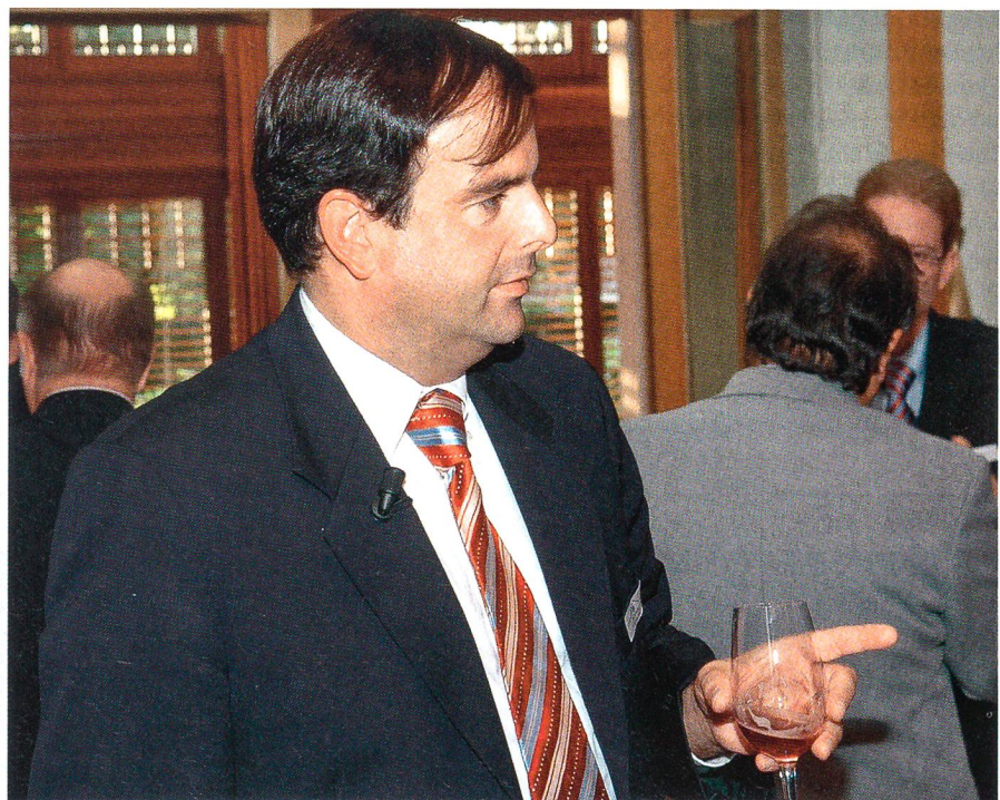
Nationalrat Gerhard Pfister: «Political correctness bedroht die Freiheit.»

Die Gründungsgeschichte der Vereinigten Staaten zeigt eindrücklich, wie man einen Staat aufbaut, der auf dem Natur-