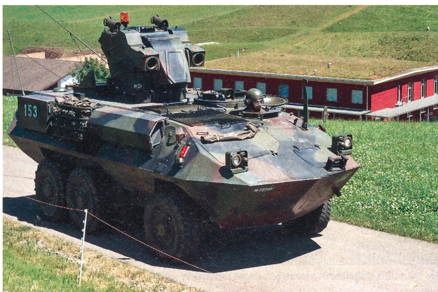
Sicherheit ist stets im umfassenden Sinn zu verstehen – ein Panzerjäger der Armee.

Unsere nationale Unsicherheit ist heute und in Zukunft besonders geprägt durch den ausländischen Gewaltextremismus, den europaweit zunehmenden islami-