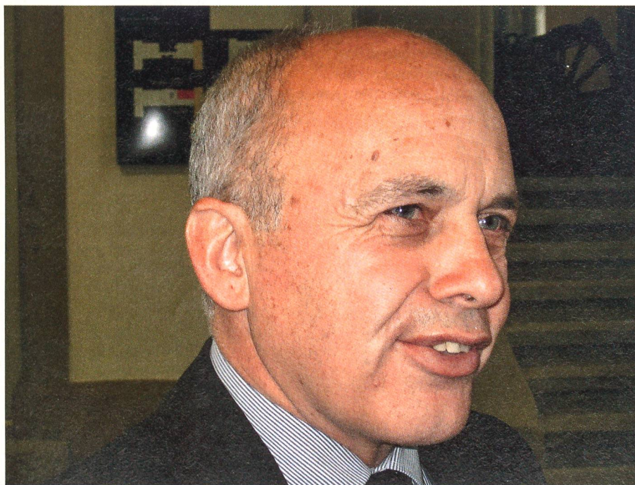
Maurer: «Stets wird ein politischer Takt geklopft».

Damit wird die offene Debatte verunmöglicht, es wird suggeriert statt debattiert.