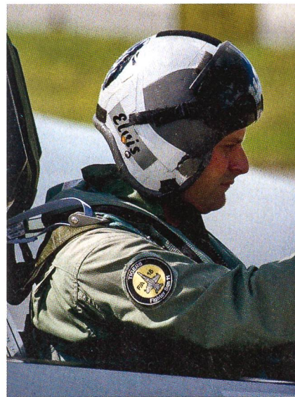
Früh übt sich, wer Pilot werden will.