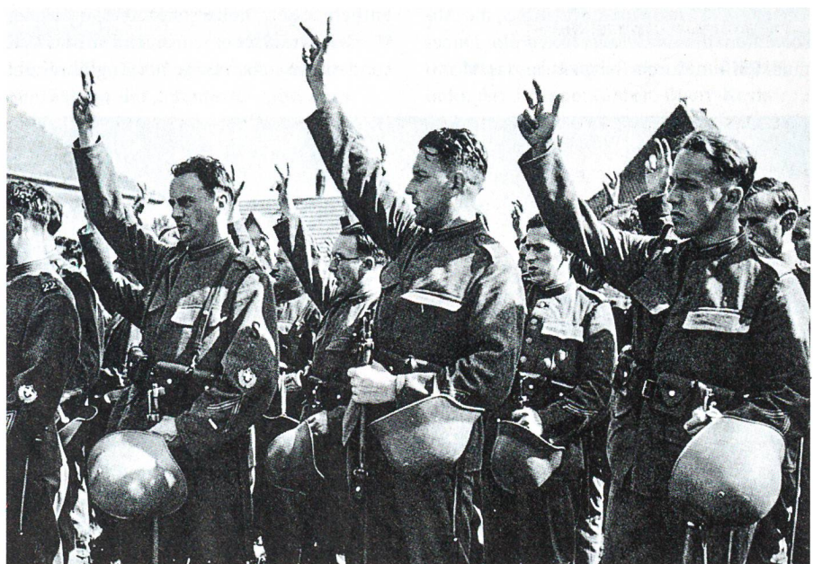
2. September 1939: Verteidigung der Truppe durch einen Vertreter des Bundesrates.