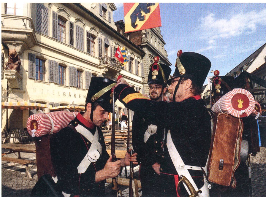
In den Strassen von Langenthal: Erinnerung an 1822.