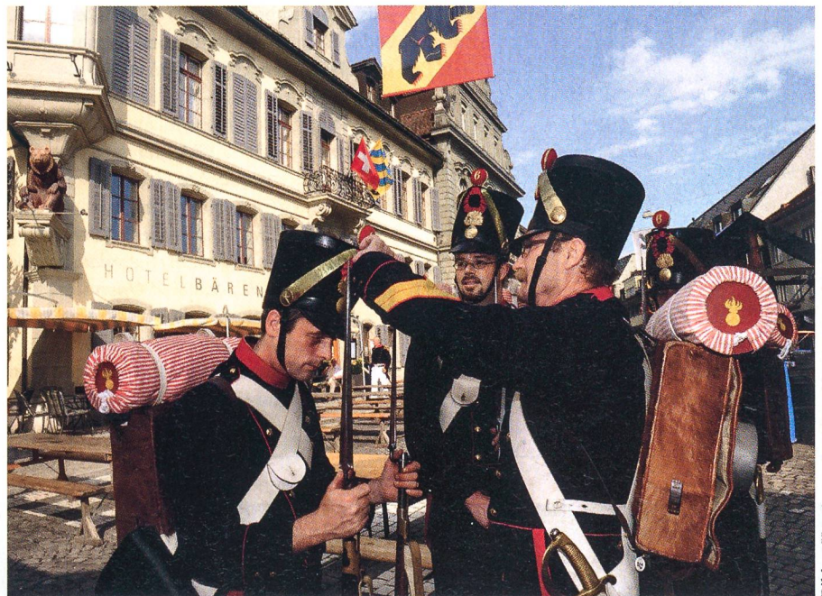
In den Strassen von Langenthal: Erinnerung an 1822.