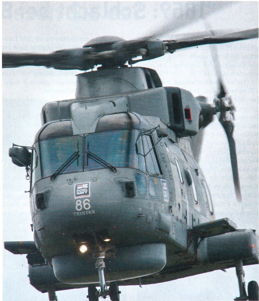
Royal Navy Helikopter Merlin HM1.

Die Gespräche mit den Vertretern der drei Nationen, die bereits Erfahrungen mit dem Eurofighter gemacht haben, zeigten, dass das Fluggerät der vierten Generation die erwarteten Leistungen erbringt und insbesondere mit Blick auf die lange Einsatzdauer und die Ausbaufähigkeit zu überzeugen vermag. ☑