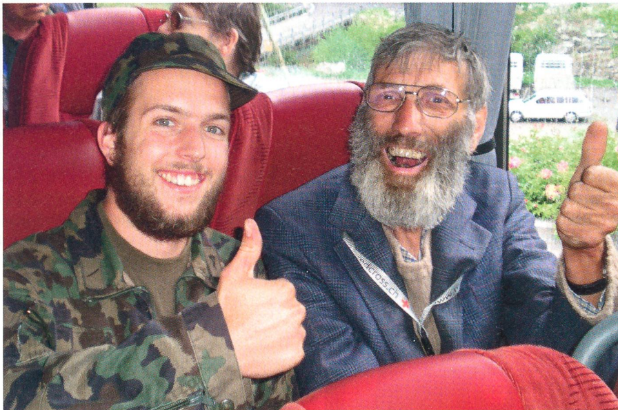
«Freude bereiten»: Glückliche Gesichter auf der Rückfahrt von der Bettmeralp.

Leider war uns Petrus dieses Jahr nicht so hold, sodass einige der Ausflüge nicht bei idealer Witterung durchgeführt werden konnten. Die eigens für das AIB eingerich-