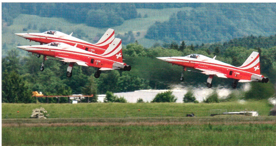
Die Patrouille Suisse beim Start in Emmen.