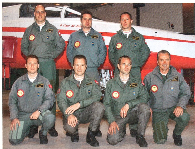
Die legendäre Patrouille Suisse.