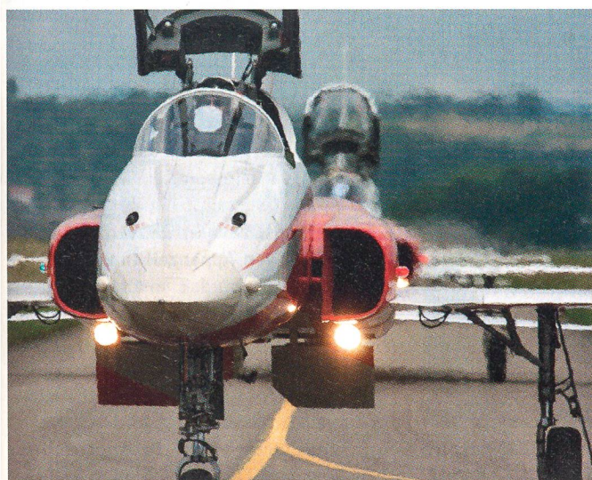
Frontansicht: Der Tiger...