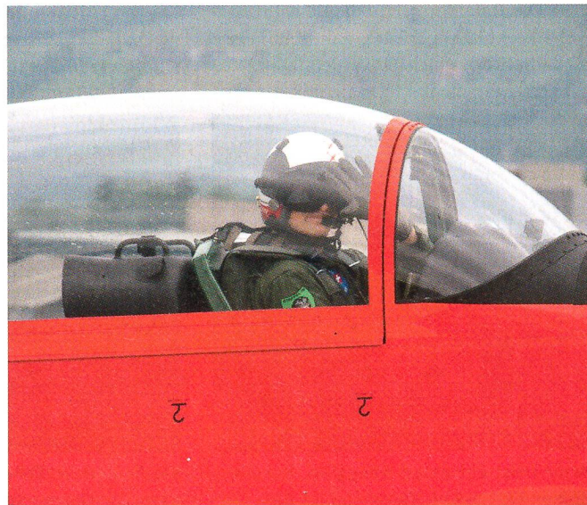
...und das PC-7-Team.