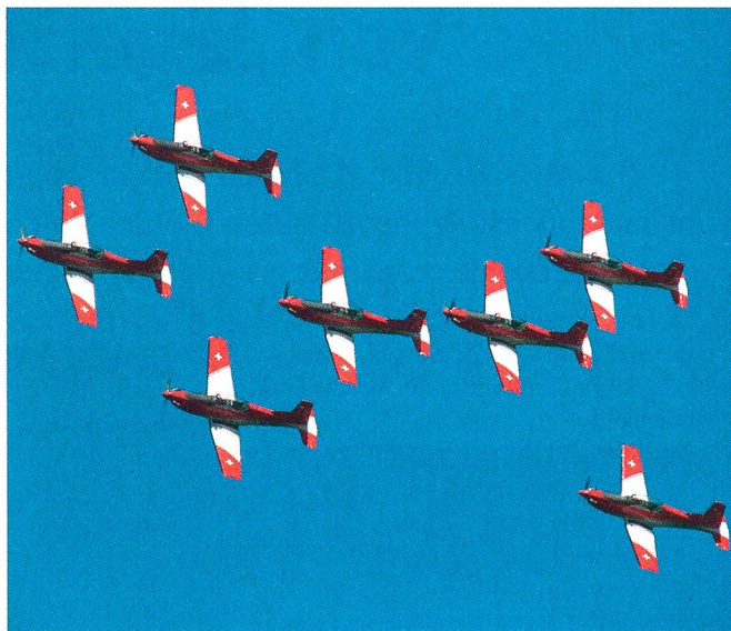
...und das PC-7-Team.