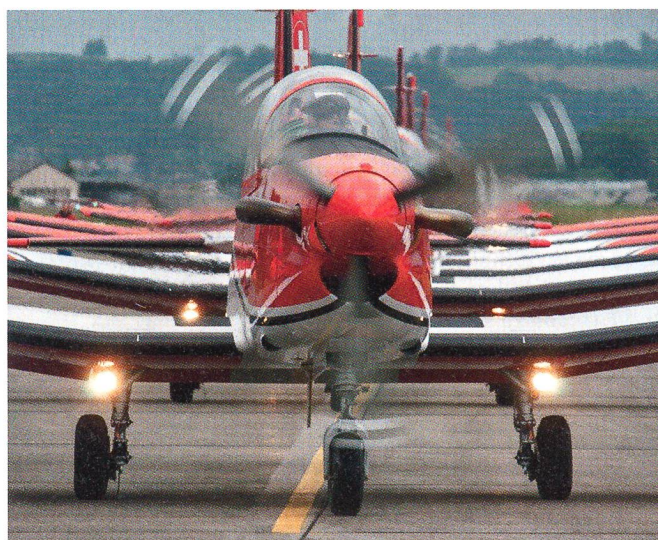
...und der PC-7.