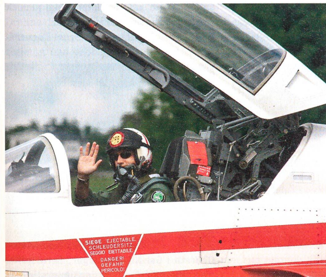
Zurück vom Kunstflug: Die Patrouille...