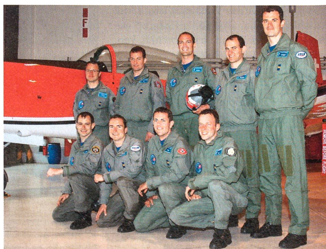
Das PC-7-Team im Jubiläumsjahr.