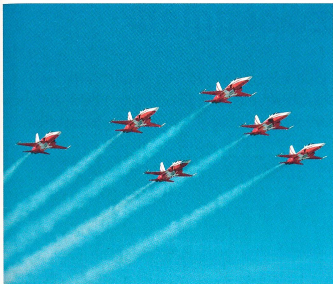
In vollem Einsatz: Die Patrouille...