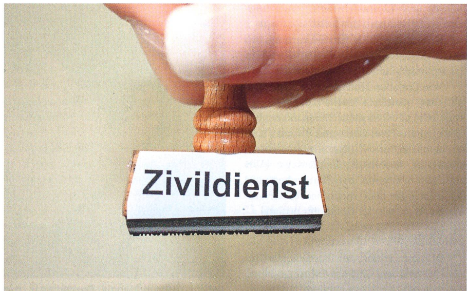
Seit dem 1. April 2009 herrscht in den militärischen Schulen Zivildienst-Alarm.

Auf dem Internet bieten mehrere Beratungsstellen ihre Dienste an. Tüchtig am Werk ist – das versteht sich von selbst – die Gesellschaft für eine Schweiz ohne Armee, die GSoA. Für den Soldaten, der es überdrüssig ist, den harten Militärdienst zu leis-