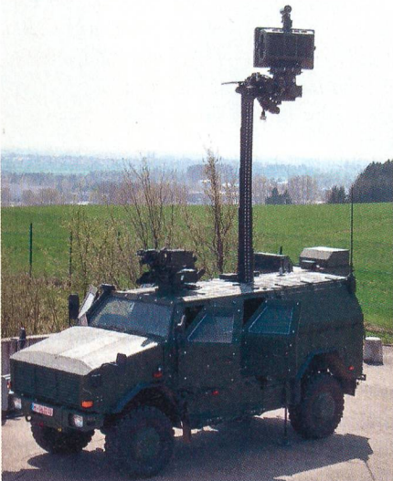
BÜR auf Dingo 2.

EADS Defence & Security (DS) rüstet die Bundeswehr mit einem neuartigen Bodenüberwachungsradar (BÜR) aus, das Bewegungen am Boden und im bodennahen Luftraum mit grosser Präzision ortet. Gemäss offiziellen Berichten wurde der erste von zwei seriennahen Systemdemonstratoren übergeben, welcher nun durch die Wehrtechnischen Dienststellen erprobt wird. Ab 2012 ist die Serienlieferung von ca. 80 BÜR-Systemen geplant, um damit eine Lücke der deutschen Streitkräfte im Be-