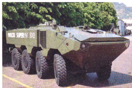
Iveco SUPERAV 8x8.

Der italienische Fahrzeughersteller Iveco Defence Vehicles hat seinen neuen mittleren Radschützenpanzer des Typs SUPERAV 8x8 vorgestellt. Der SUPERAV wurde so ausgelegt, dass er mit einem Flugzeug des Typs C-130 transportiert werden kann, bietet bis zu 12 Soldaten Platz und hat bei