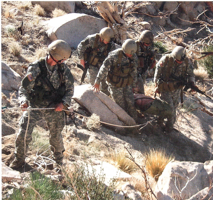
Verletzentransport in schwierigem Gelände.