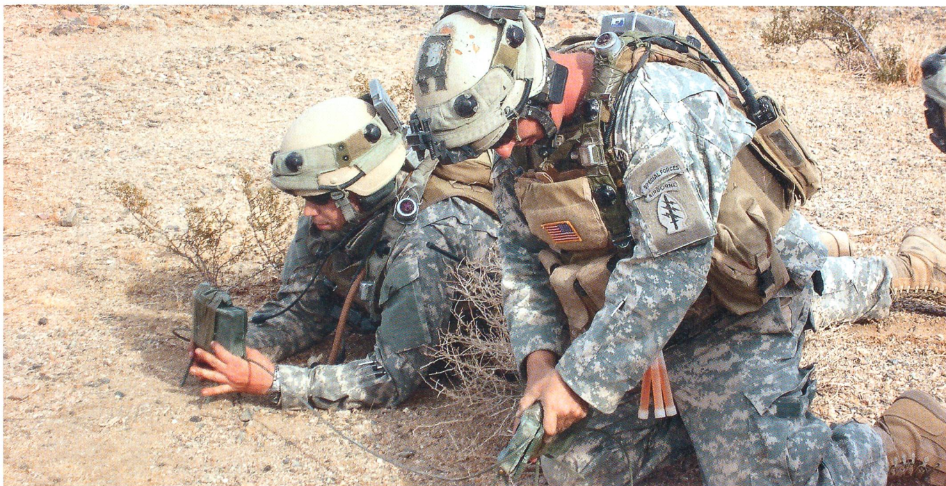
Zwei Soldaten der Special Forces beim Verlegen einer Richtladung.

■ Die Schweizer Armee verfügt über keine praktische Erfahrungen im Kampfeinsatz. Wie beurteilen Sie die Unterschiede zwischen Ausbildungs- und Einsatzarmee?