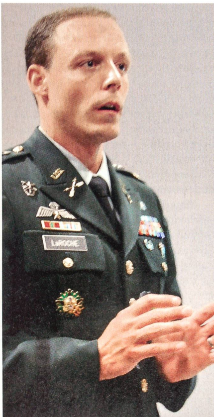
Major Marc LaRoche.

LaRoche: Das Schwergewicht in der Ausbildung liegt heute beim Kampf gegen Aufständische (Counterinsurgency). In diesem asymmetrischen Umfeld gelten heute wieder Einsatzgrundsätze, denen man seit dem Vietnamkrieg keine Beachtung mehr schenkte.