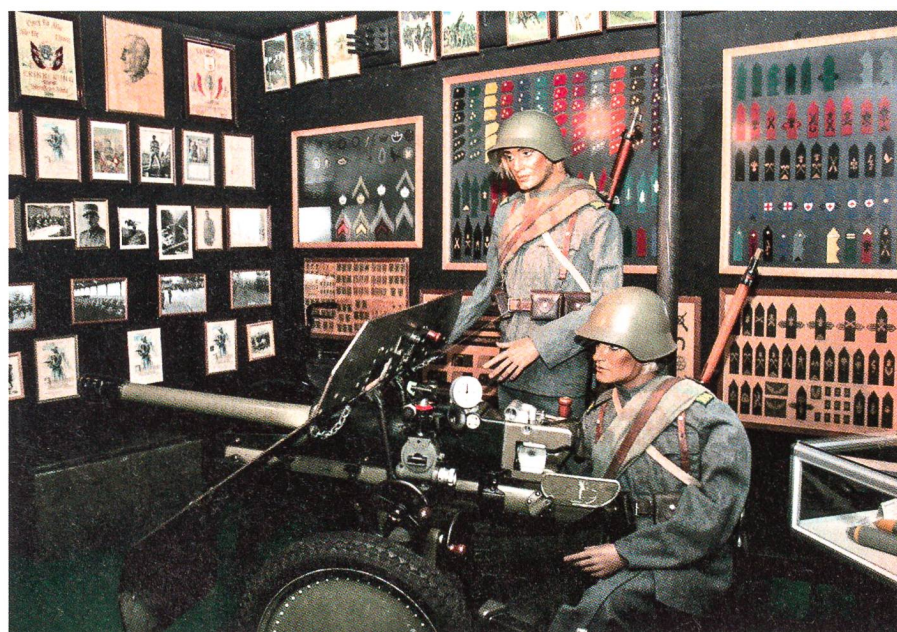
Das Ausstellungsgut wird anschaulich dargeboten.