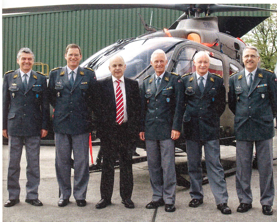
Bundesrat Ueli Maurer mit fünf Höheren Stabsoffizieren der Luftwaffe.

In der Realität seien es aber nur 3,6 Milliarden Franken. «Bisher wurden noch keine Abstriche vorgenommen. Wir müssen nun entweder mehr Geld haben, oder die Armee muss weiter abbauen», so der VBS-Chef. Bezüglich des TTE sagte Maurer, man kläre im Moment alle Fragen ab, die in Zusammenhang mit diesem Vorhaben in Zukunft gestellt werden könnten. Er versicherte den rund 700 anwesenden Luftwaffen-Kadern: «Obwohl wir gründliche Abklärungen treffen ist klar: wir brauchen diese Flugzeuge.»