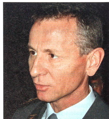
Divisionär Roland Favre erarbeitet Vorschläge zur Streitkräftebasis.