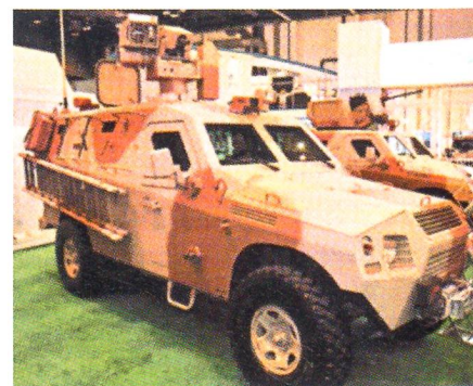
Leichtes gepanzertes Radfahrzeug des Typs «Al Shibl 2».

Das Saudi Arabische Rüstungsunternehmen AVF hat kürzlich zwei leichte gepanzerte Fahrzeuge mit der Bezeichnung Al Shibl 1 und 2 vorgestellt. Um die Betriebskosten möglichst tief zu halten, wurde als Basis der Toyota Land Cruiser verwendet, welcher im Nahen Osten bei Privaten und Behörden weit verbreitet ist. Das Chassis