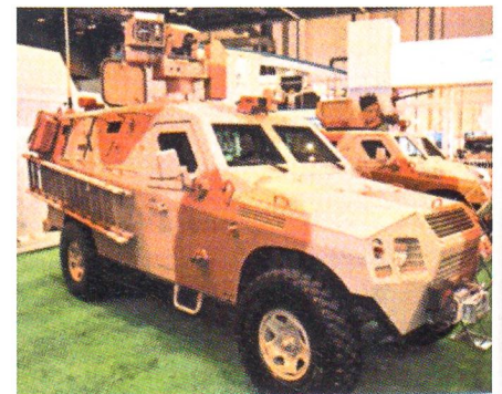
Leichtes gepanzertes Radfahrzeug des Typs «Al Shibl 2».

Das Saudi Arabische Rüstungsunternehmen AVF hat kürzlich zwei leichte gepanzerte Fahrzeuge mit der Bezeichnung Al Shibl 1 und 2 vorgestellt. Um die Betriebskosten möglichst tief zu halten, wurde als Basis der Toyota Land Cruiser verwendet, welcher im Nahen Osten bei Privaten und Behörden weit verbreitet ist. Das Chassis