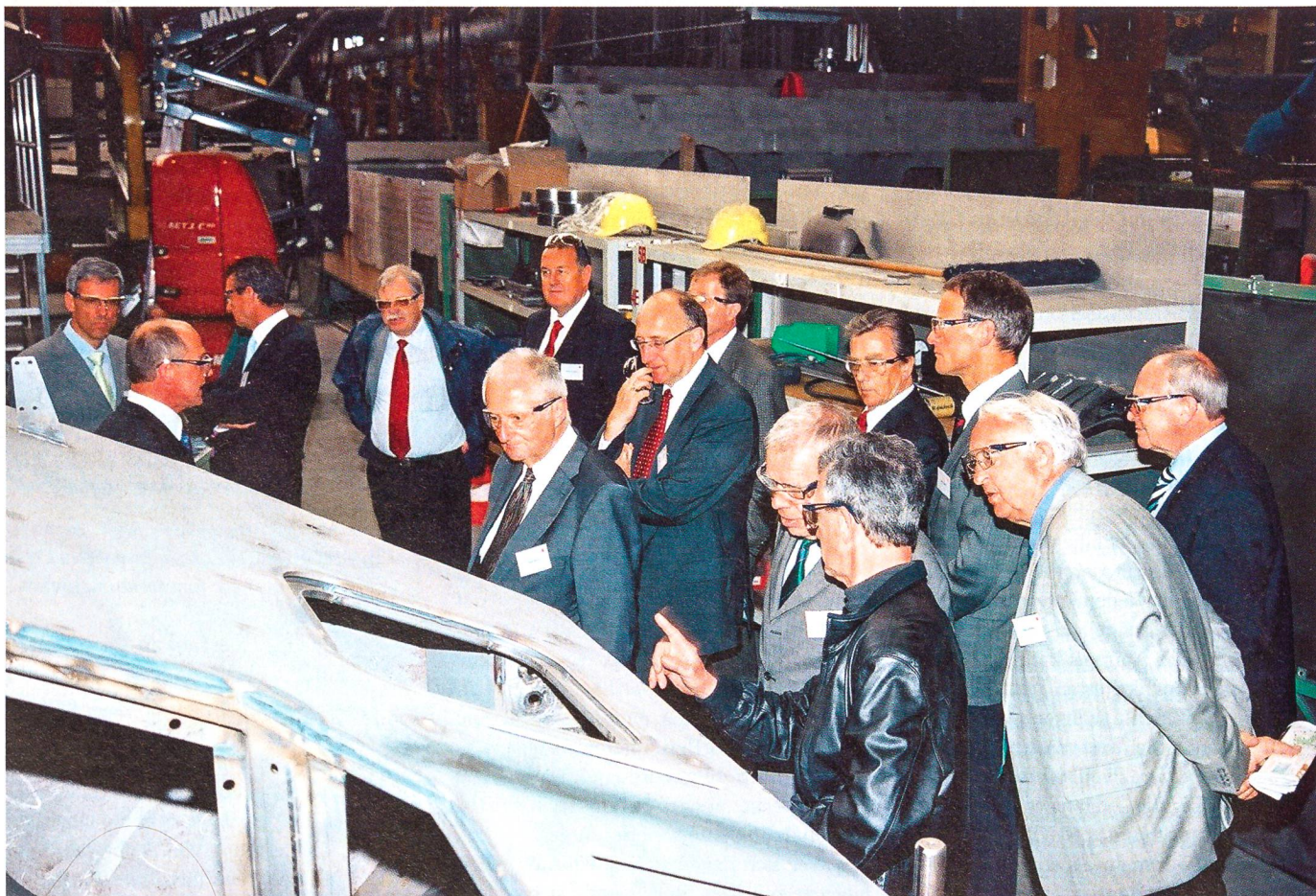
In der Firma MOWAG in Kreuzlingen erlebten die Tagungsteilnehmer eine höchst instruktive Führung durch die Produktion.