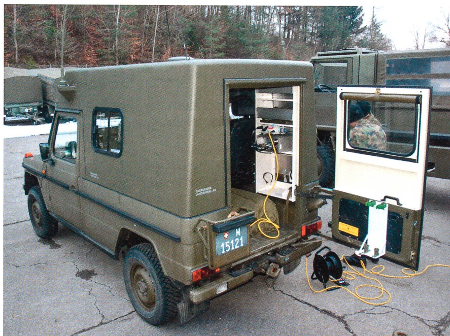
Das Hauptquartier auf Rädern: Puch-Geländewagen mit neuer Bogenantenne.

Eingesetzt wird das Funksystem künftig, um die Verbindungen der Einsatzbrigaden zu ihren Bataillonen und zur vorgesetzten Stelle auch ohne Richtstrahl oder fixer Leitung zu gewährleisten. Hierzu werden sämtliche FU Bataillone mit dem SE-240