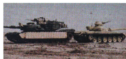
Amerikanischer Abrams und irakischer T-72 bei einem gemeinsamen Training in der Wüste.

Die 140 Kampfpanzer des Typs Abrams M1A1, welche die irakischen Streitkräfte von den USA erhalten werden, werden auf die Version M1A1SA aufgerüstet. Diese