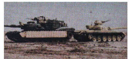
Amerikanischer Abrams und irakischer T-72 bei einem gemeinsamen Training in der Wüste.

Die 140 Kampfpanzer des Typs Abrams M1A1, welche die irakischen Streitkräfte von den USA erhalten werden, werden auf die Version M1A1SA aufgerüstet. Diese