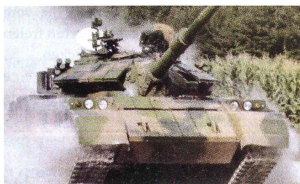
Poly Technologies Type 59P.

Der chinesische Rüstungshersteller Poly Technologies hat einen kampfwertgesteigerten Kampfpanzer «Type 59» vorgestellt, welcher in den Bereichen Schutz, Feuerkraft und Beweglichkeit erheblich verbessert wurde. Das neue Modell mit der Bezeichnung «Type 59P» wurde zum Schutz gegen Lenk Waffen und Geschosse mit Hohlladungen respektive Tandemhohlladungen mit einer Reaktivpanzerung der zweiten Generation ausgestattet, welche am Turm und im Frontbereich angebracht ist. Weiter wurde ein Motor mit neu 730 statt nur 530 PS eingebaut. Zur verbesserten Zielerfassung und -bekämpfung wurde ein neues