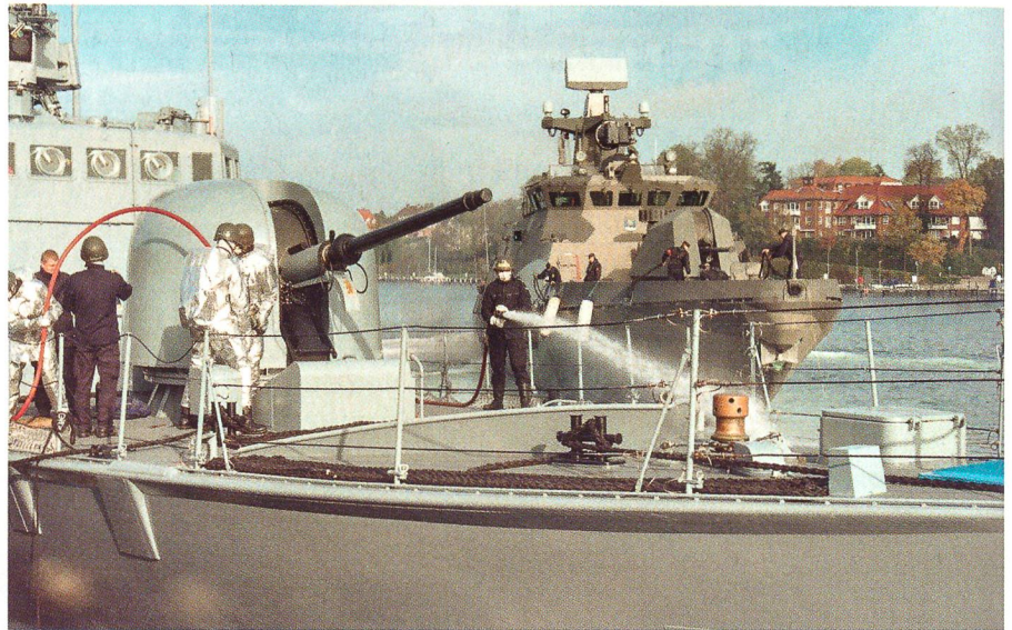
Nach einem Hilferuf der zivilen Behörden aus Neustadt (Ostholstein) laufen diverse Einheiten des Flottenverbandes im Hafen zur Hilfeleistung ein. Hier hat das deutsche Schnellboote «Gepard» (links), das noch einen simulierten Brand an Bord zu löschen hat, bereits festgemacht, während sich die finnische «Hamina» dem Pier nähert.

Danach folgte über eine intensive «Luftbrücke» der beiden Sea King-Helikopter der «Frankfurt aM» der Transport von weiterem Personal und Material für die ersten Aufträge, welche vor allem eine sanitätsdienstliche Hilfestellung, die Bekämpfung