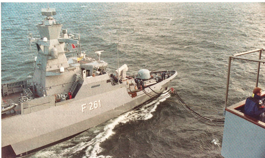
Die neue Korvette der deutschen Marine «Magdeburg» wird auf hoher See mit 76 m 3 Treibstoff vom Einsatzgruppenversorger «Frankfurt aM» versorgt.