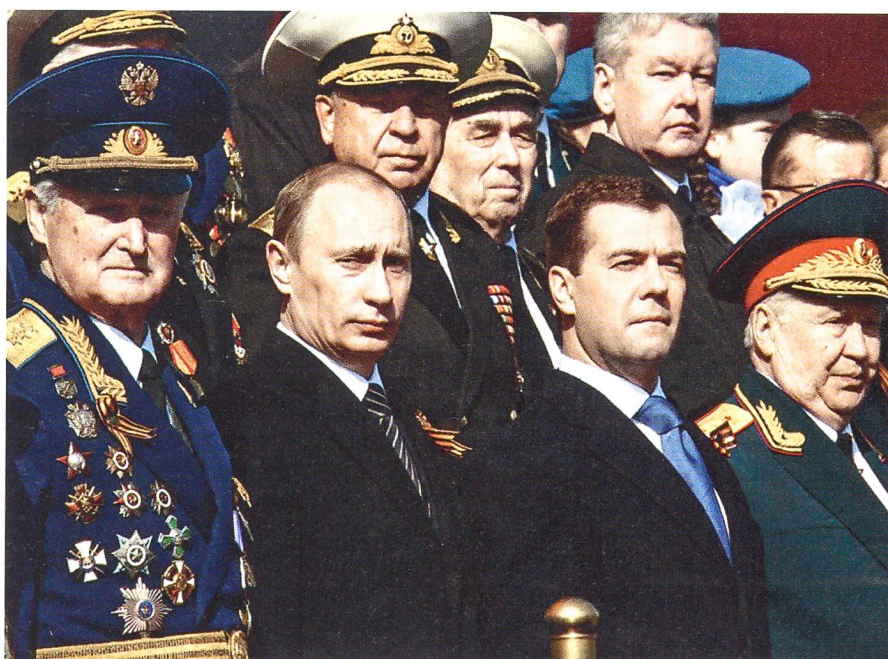
Die russische Militärführung mit Ministerpräsident Putin und Staatspräsident Medwedjew.

Mühlemann: Wahrscheinlich entspricht der Stil von Präsident Obama eher der Verhaltensweise von Staatschef Medwedjew. Es scheint, dass die beiden bei ihrer ersten Begegnung den Kontakt miteinander gut ge-