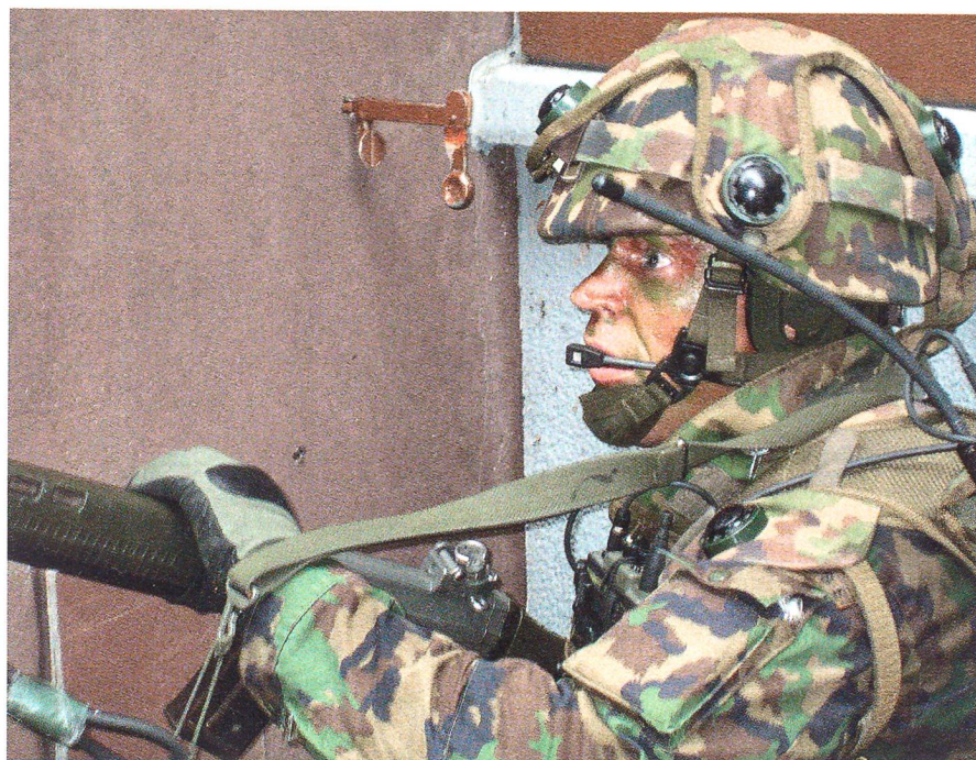
Die Schweizer Armee muss sich auf das gefährlichste Szenario vorbereiten.

Der Aufstieg neuer Religionen lässt sich auch in unserem Land nicht ignorieren. In Madrid und London ist der Kampf gegen die westliche Gesellschaftsordnung eskaliert. Ich meine: Die Schweiz ist vor solchen Bedrohungen nicht gefeit; auch wir können das Ziel von Extremisten werden.