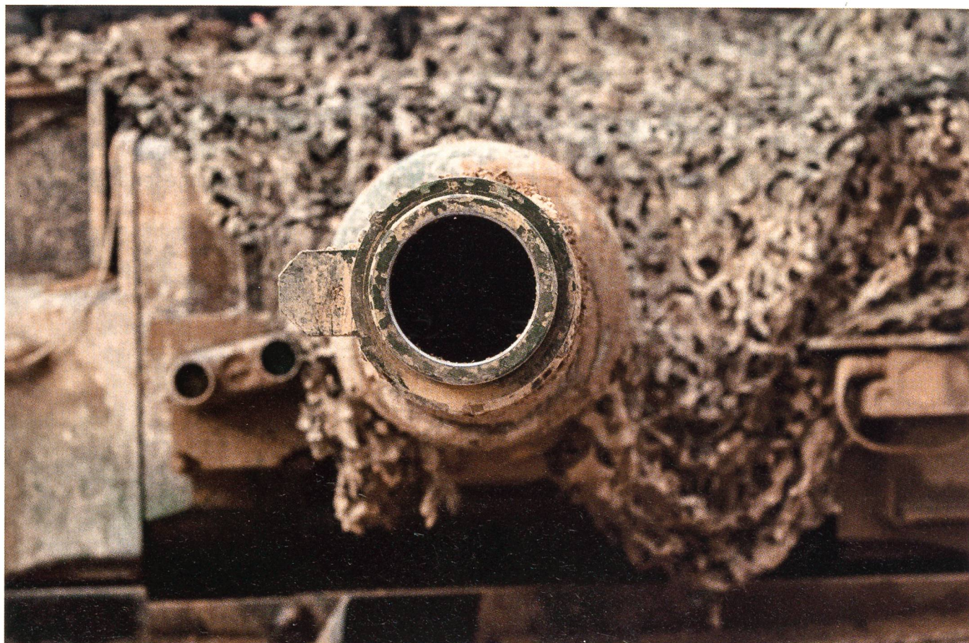
Das furchterregende Rohr des Kampfpanzers Leopard 2.