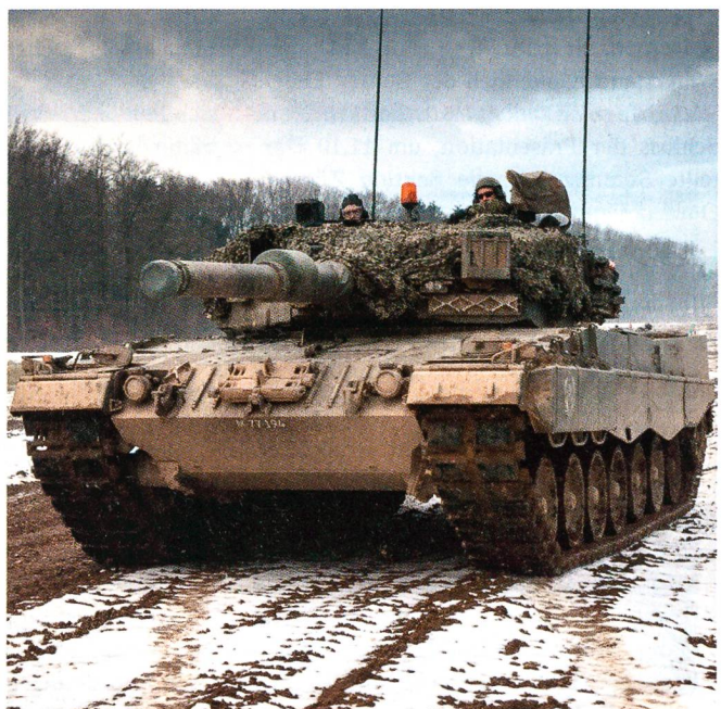
Ein Kampfpanzer im Stoss.