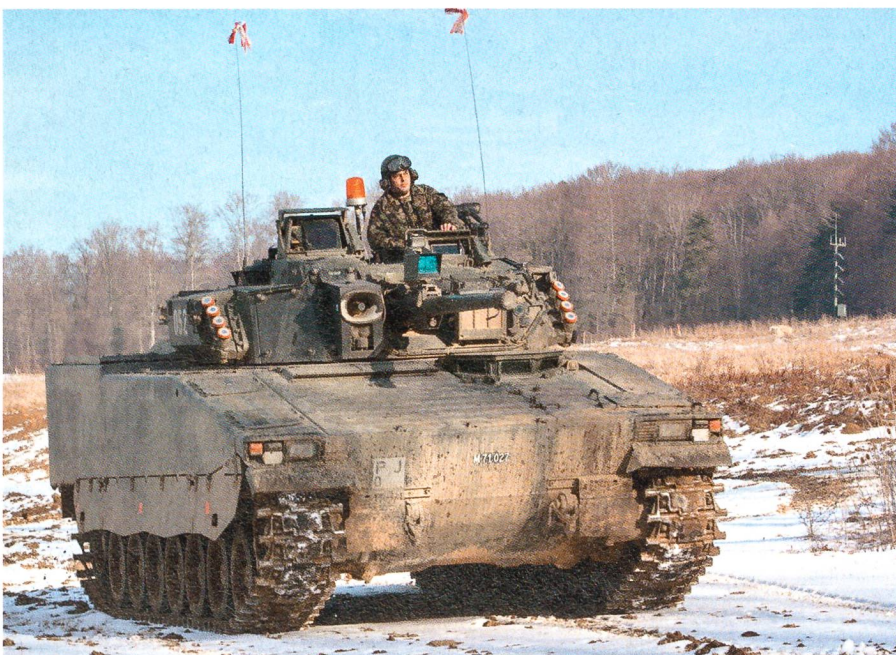
Ein Schützenpanzer der «roten» Partei.

Auch die Integration der einsatzunterstellten Elemente hat ihre Tücken, die erst in solchen Übungen erkannt und überwunden werden können. So muss beispielsweise sichergestellt sein, dass überall die gleichen Führungsunterlagen verwendet