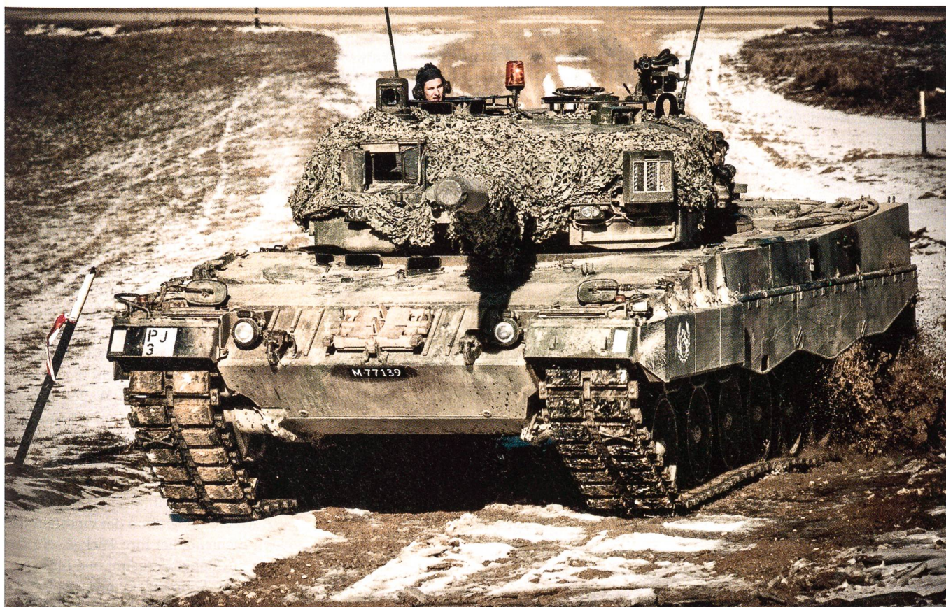
Ein Leopard 2 der «blauen» Partei beim Vorstossen in der «Wildnis» von Bure.

Die Panzergrenadiere haben mit der Einführung des Schützenpanzers 2000 (CV9030) eine massive Steigerung ihrer Kampfkraft erfahren. Sie haben nicht länger nur Unterstützungs- und Begleitfunktion sondern werden immer mehr zu unabhängigen Wegbereitern für die Kampfpanzer (Sichern der Angriffsgrundstellung, Nehmen und Halten von Schlüsselgelände, Öffnen und Offenhalten von Engnissen, Kampf in überbautem Gebiet). Auch erlau-