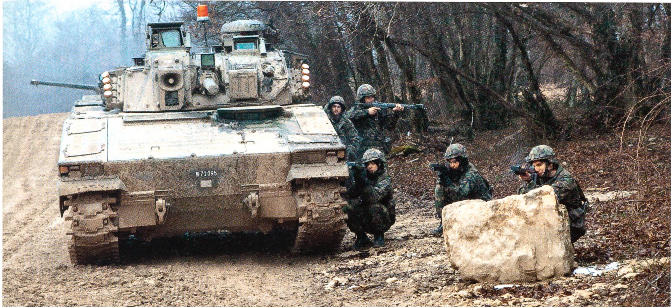
Abgessene Grenadiere im Gefecht am Waldrand.

werden. Auch der Kommunikation und den Funkverbindungen kommt grosse Bedeutung zu. Gerade bei täglich wechselnden Einsatzunterstellungen aufgrund des knappen und alternierenden Personalbestandes im Bataillon führt dies zu einem grossen Aufwand, der bei den entsprechenden Gefechtsvorbereitungen berücksichtigt werden muss.