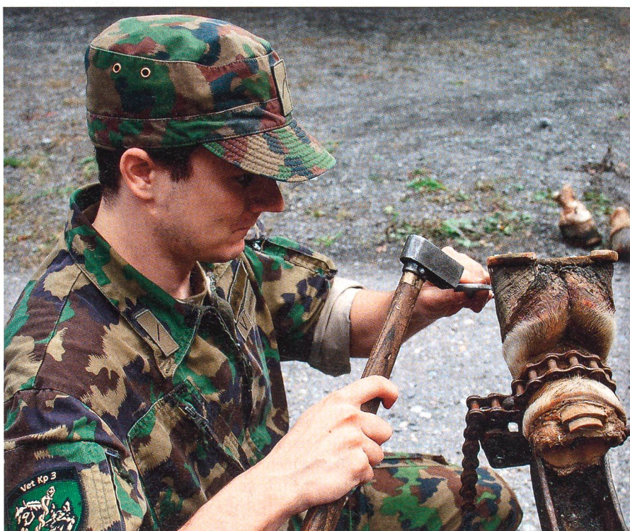
In der Feldschmiede üben die Soldaten am Hufmodell das Entfernen von Hufeisen.

Die Spezialisten der Veterinärtruppen betreuen darin kranke und verletzte Ar-