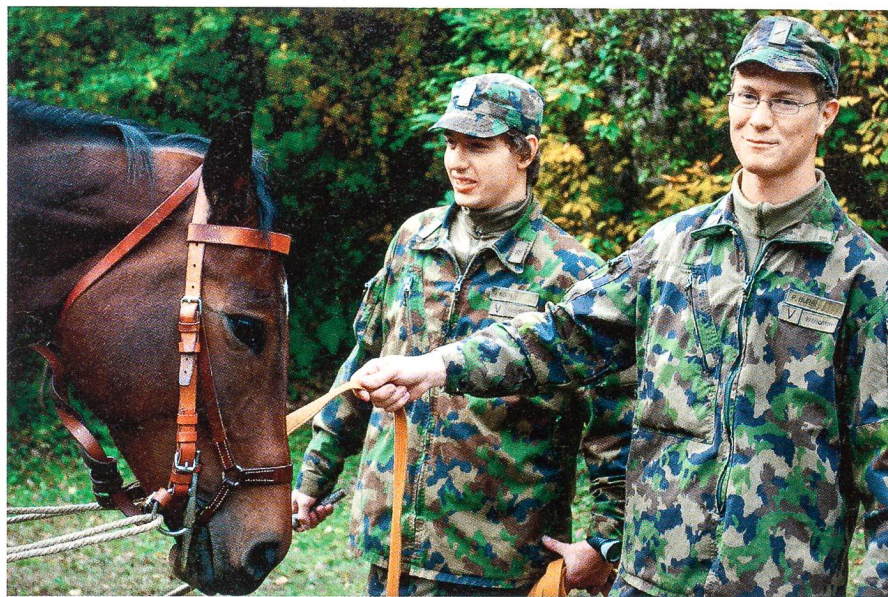
Nach der tierärztlichen Behandlung wird das Pferd sachkundig wieder fit gemacht.