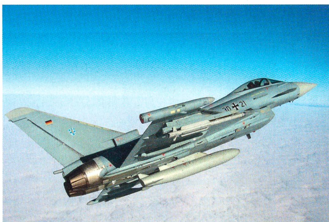
Der Eurofighter von EADS.

Auch für die Minimierung der Betriebskosten und die Sicherstellung der Kompetenzen der Schweizer Industrie bei den Luftfahrttechnologien werden neue Wege geprüft. Eine strategische Kooperation zwischen den Flugzeugfirmen, Armasuisse und der Schweizer Luftfahrtindustrie soll dazu beitragen, dass sich die Schweiz an Weiterentwicklungen des TTE beteiligen kann. Weiter werden im Unterhaltsbereich Wege gesucht um Kosten zu senken.