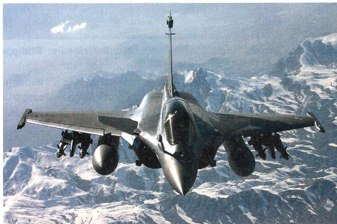
Der Rafale von Dassault.