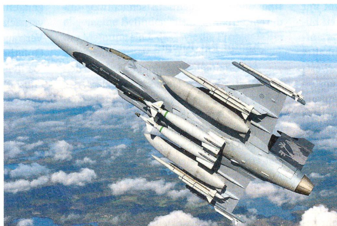
Der Gripen von Saab.

Der in zwei Stufen verlaufende Prozess der Offertanfragen begann im Januar 2008 mit der ersten, von Armasuisse an die vier Flugzeughersteller Boeing, Dassault, EADS und Saab gerichteten Offertanfrage. In der Folge verzichtete Boeing im April 2008 darauf, ein Angebot einzureichen. Die verbliebenen Herstellerfirmen reichten ihre Offerten im Juli 2008 ein. Mit der Abgabe der zweiten Offertanfrage haben die Herstellerfirmen nun in ausreichendem Mass Zeit, eine aufdatierte Offerte einzureichen.