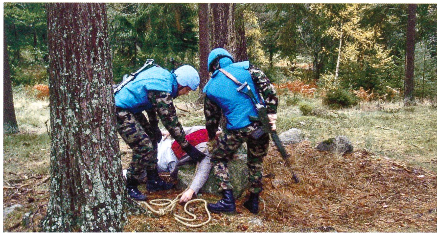
Realistische Aktion im lockeren Schwedenwald.

Der grösste Teil der Ausbildung fand draussen statt, ein grosses Plus dieser Ausbildung. Zu Beginn der ersten Ausbildungswoche gab es eine zweitägige theoretische