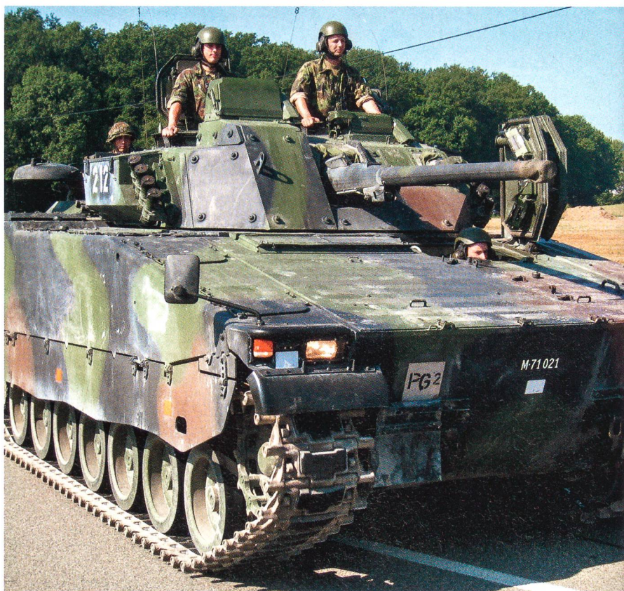
Panzergrenadiere der Panzerbrigade 11 defilierten am 27. August 2008 in Winterthur.

In einer Übung wurde das Material absichtlich in Bière gelassen: «Doch die Logistikkbasis Hinwil lieferte einen zweiten Materialsatz, der zeitgerecht eingebaut wurde. Unsere Armee ist eindeutig unterfinanziert. Als ich noch Leutnant war, erhielten wir das Material ab Wunschliste perfekt geliefert. Wir schöpften noch aus dem Vollen.