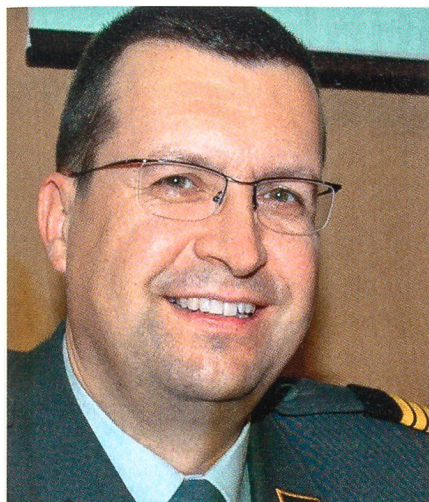
Oberst i Gst Rolf Siegenthaler: «Das Dienstreglement bildet die Grundlage.»

und diese werden genutzt. Im Dienstbetrieb müssen die Kader oft mit drei Stunden Schlaf pro Nacht auskommen. Aus einem Panzerbataillon hörte ich, dass es im WK kein einziges Mal Ausgang gab. Da muss ich vielleicht etwas korrigieren.»