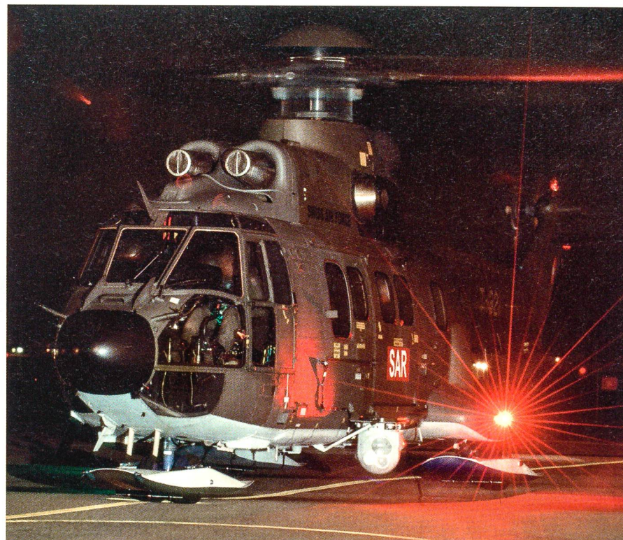
Nachtbetrieb auf dem Flugplatz Dübendorf: Ein Super-Puma-Helikopter. Gesichert ist der Helikopter-Betrieb in Dübendorf bis zum Jahr 2014.

Dabei werden immer wieder die entscheidenden Fakten schlichtwegs unterdrückt oder bewusst ausgeblendet. Tatsache ist: Das Flugplatzgelände ist Eigentum der Eidgenossenschaft. Die gesamte Logis-