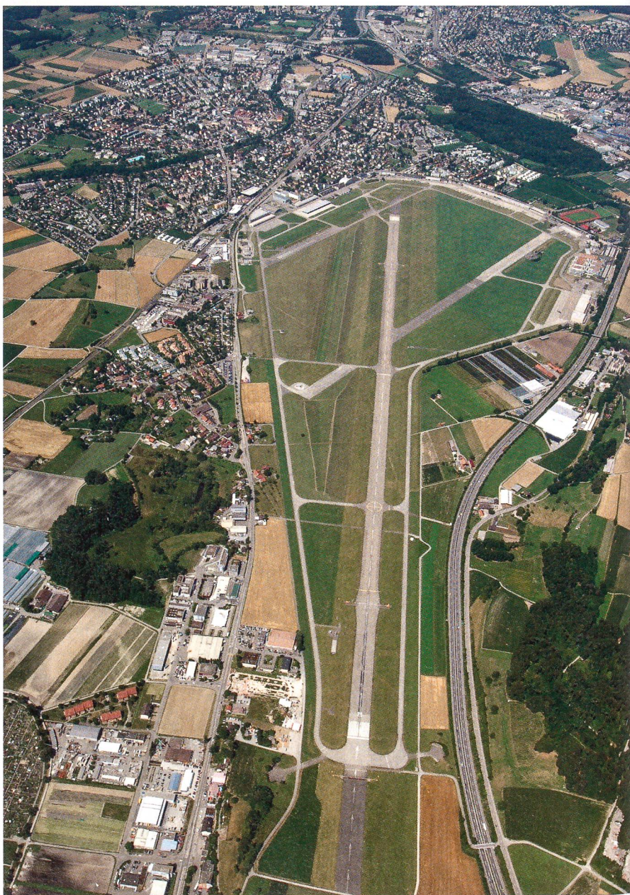
Der Flugplatz Dübendorf: Gut erkennbar das ausgedehnte Gelände mit der Stadt.

Doch die schlimmsten Befürchtungen der Kritiker wurden in der Zwischenzeit so-