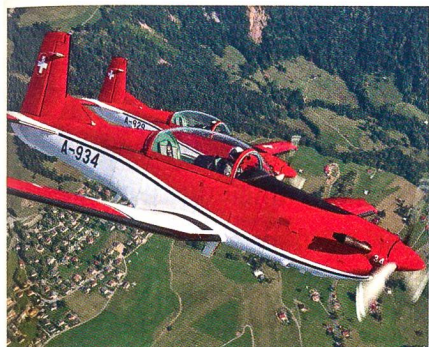
Das Kunstflugteam mit den Pilatus PC-7: Eine Visitenkarte der Schweizer Armee.