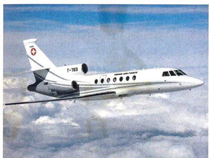
Der Falcon 50, die komfortable, elegante Maschine für den Lufttransport.

gar übertroffen. Die Konzentration des Fluglärms auf nur noch drei Flugplätze, zum Teil in engen Gebirgstälern, beeinträchtigt die Lebensqualität der dort ansässigen Bevölkerung in hohem Masse.