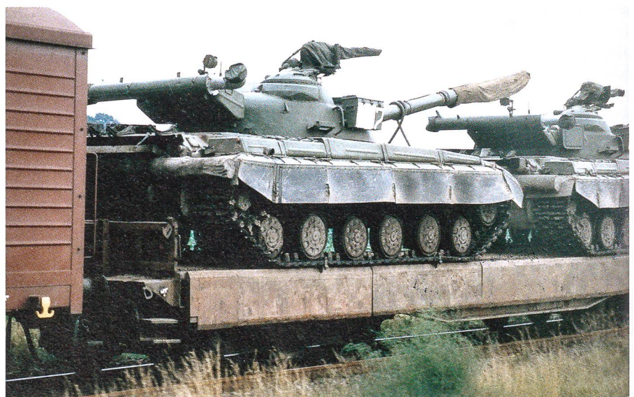
In der ehemaligen DDR hatte die «Gruppe Sowjetischer Truppen in Deutschland» (GSTD) fünf kampfstärke Armeen mit rund 20 Divisionen disloziert. Dazu gehörten über 9000 Kampfpanser. Immer wieder übte diese Riesenarmada die offensive Gefechtsform. Hier werden anlässlich einer Grossübung in der DDR 1987 T-64-Kampfpanser per Bahntransport aus einem Übungsgebiet abtransportiert.

An 11. März 1990 haben die Amerikaner die Grenzbeobachtung am Point Alpha eingestellt. Dies war auch das Jahr des letzten grossen Routine-Herbstmanövers unter der Bezeichnung «Reforger». Die Verwaltung des Geländes ging an die Bundesrepublik Deutschland über. Die Zukunft der Anlage war ungewiss, zuerst sprach