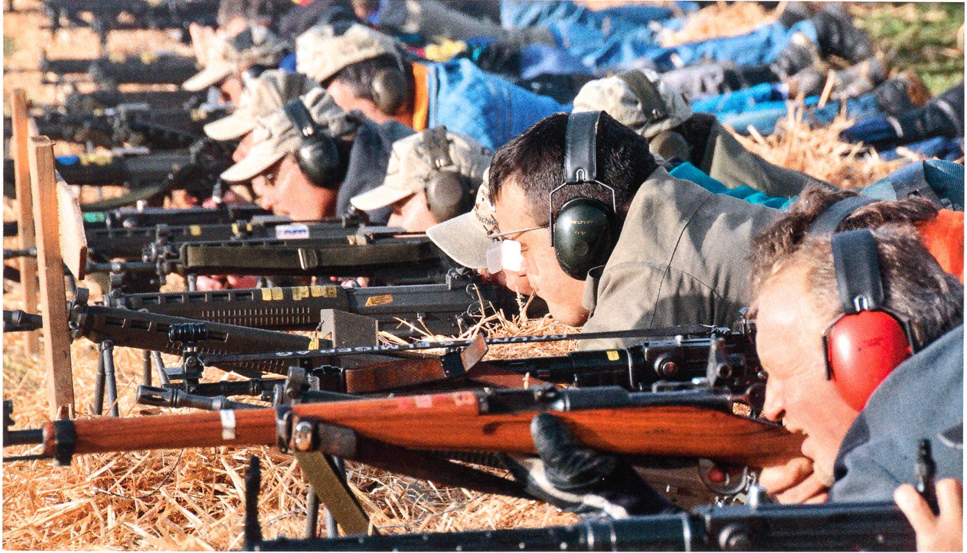
Tradition am Morgartenschiessen: Ein Karabiner unter Sturmgewehren.