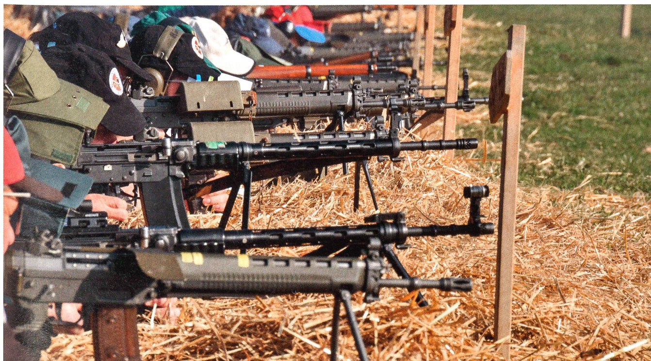
Dienstwaffen am Morgartenschiessen 2008.

Um es zum xten Mal zu sagen: Jeder Unfall mit Schusswaffen der Armee ist einer zu viel und jeder tödliche Ausgang eines solchen ist höchst bedauerlich. Tatsache ist, dass sich diese bedauerlichen Ereignisse im Vergleich zu den jährlich zehntausenden von Dienstoffizieren (mit 75 Millionen verschossenen Patronen!) absolut im Promillebereich bewegen! Trotzdem liess sich der Bundesrat zu einer unverhältnismässigen