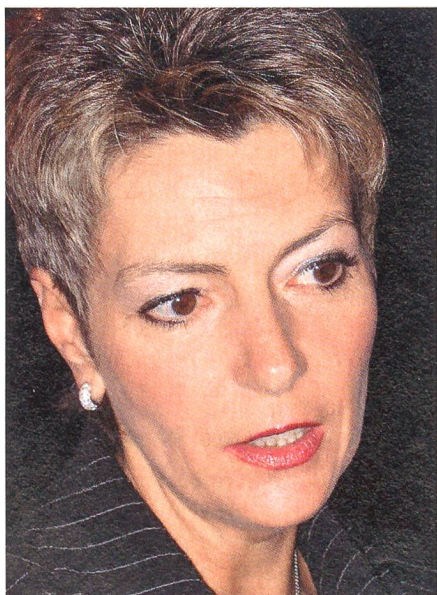
Karin Keller-Sutter: Innere Sicherheit.