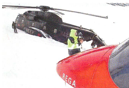
Deutscher Helikopter am Titlis: Missglückte Bugradlandung.

An Bord befanden sich zwei Piloten und vier Mechaniker. Fünf Personen blieben unverletzt. Der Flugunfall geschah bei einer Bugradlandung. Dabei berührte der Heli-