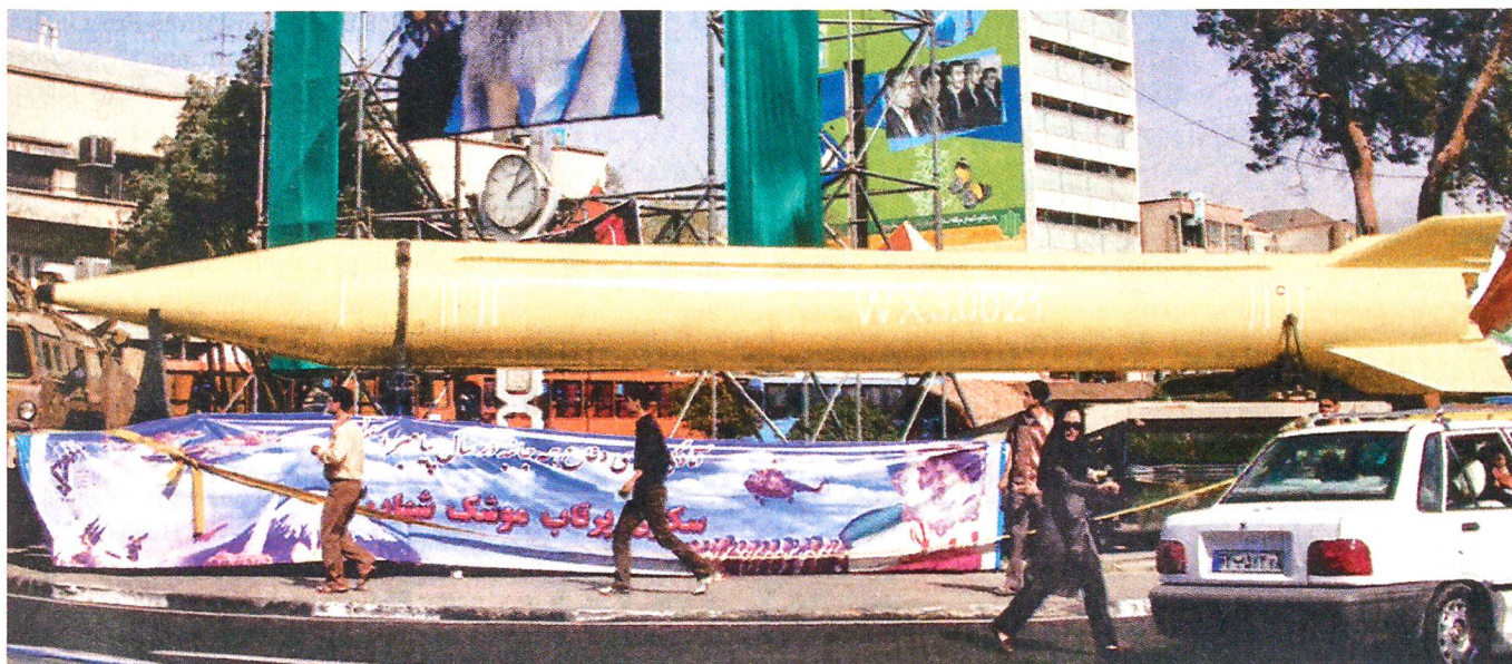
Eine iranische Shahab-Rakete in Teheran. Mit der Shahab erreichen die iranischen Streitkräfte bereits Israel und das Mittelmeer.