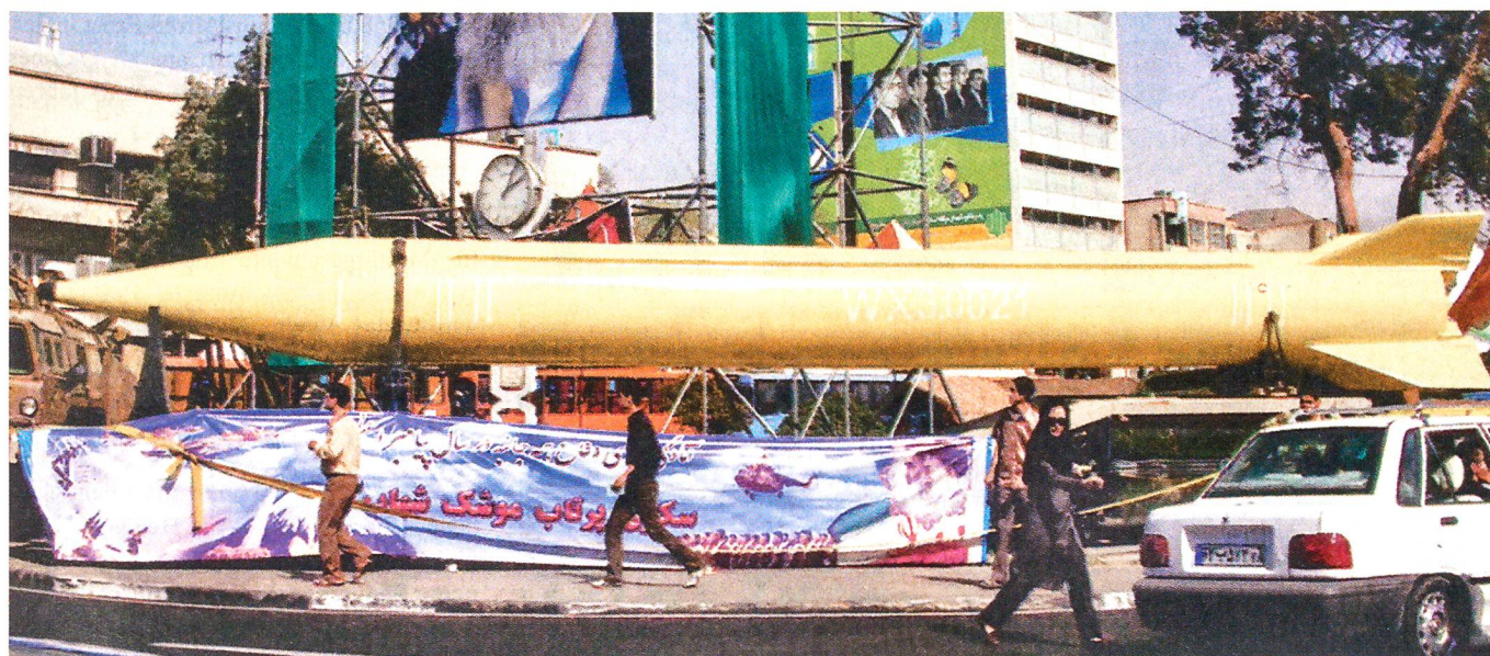
Eine iranische Shahab-Rakete in Teheran. Mit der Shahab erreichen die iranischen Streitkräfte bereits Israel und das Mittelmeer.