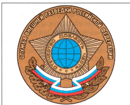
Das Emblem des Geheimdienstes SWR.