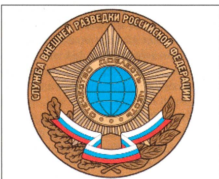
Das Emblem des Geheimdienstes SWR.