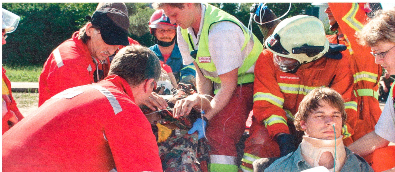
Rettungskräfte bergen «Erdbebenopfer». Detail: Das Loch im Nackenstützkragen ermöglicht ein Noteingriff an der Luftröhre.

In den WK nach der RS wird der Spitalsoldat (hospitale Stufe im Gegensatz zum Sanitätssoldaten prähospitale Stufe) im Militärspital oder zur Unterstützung in zivilen Spitälern eingesetzt. Je nach Eignung und beruflicher Ausbildung werden sie in den Spit Schulen 41 ausgebildet in den Bereichen Patientenpflege, Aufnahme, Notfall-