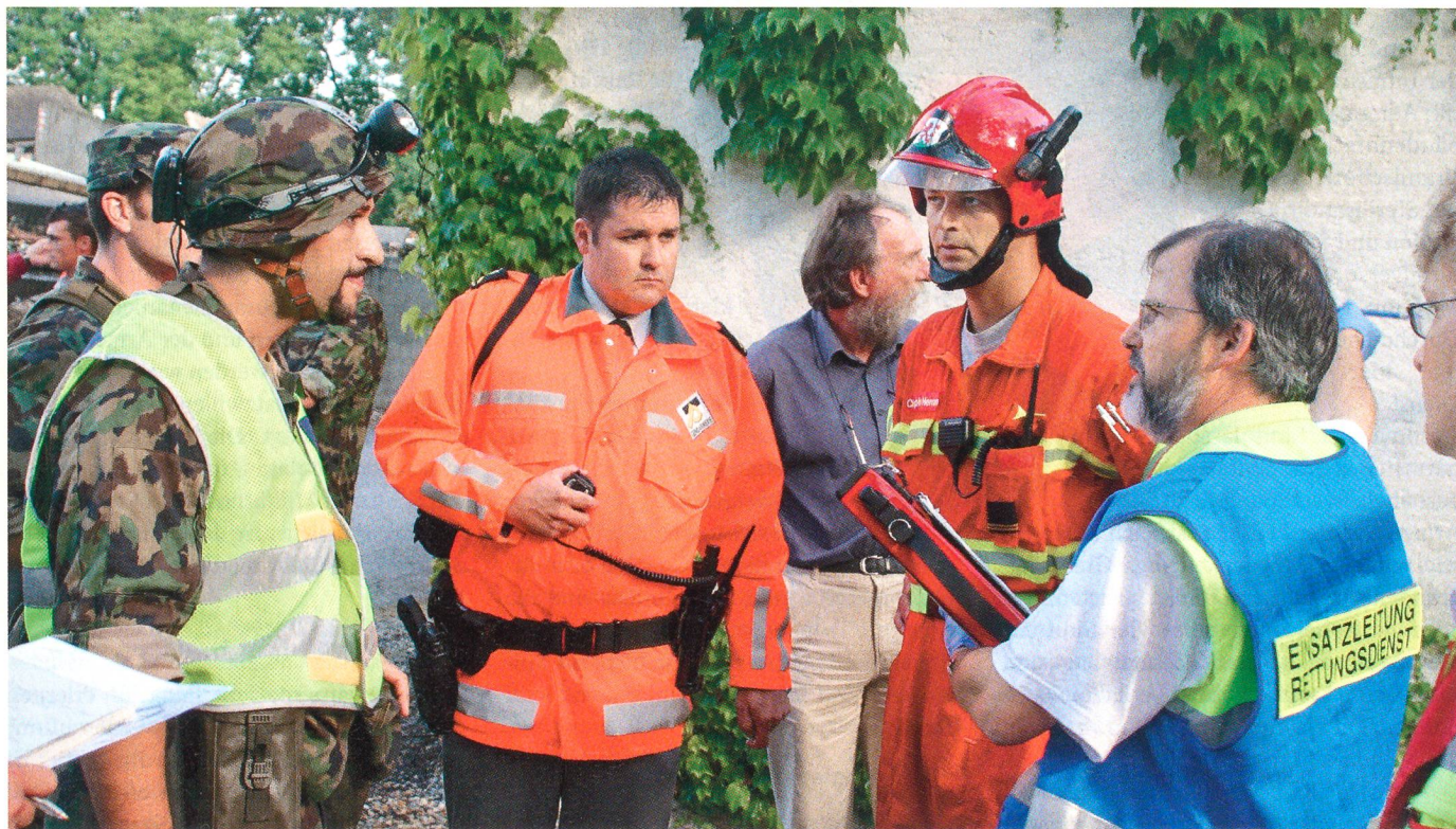
Ausgezeichnete Zusammenarbeit von Armee, Polizei, Feuerwehr und zivilen Rettungsdiensten.

mente sterilisiert werden müssen, kontaminierte Wäsche gewaschen oder wenn sich herausstellt, dass in einem Ferienhaus, in einem Altersheim, in einer Asylantenunterkunft oder in einer Kaserne, ansteckende Keime aufgetreten sind oder gar: Läuse.