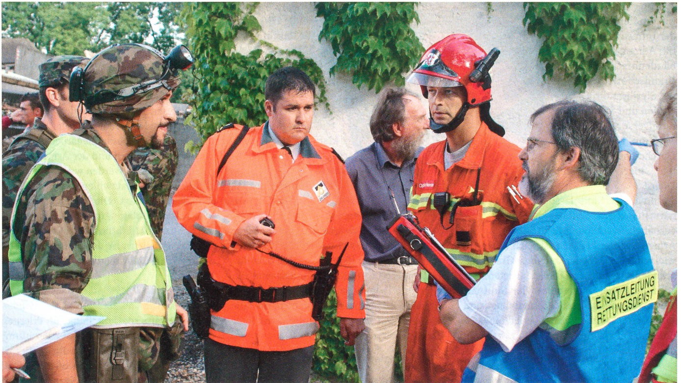
Ausgezeichnete Zusammenarbeit von Armee, Polizei, Feuerwehr und zivilen Rettungsdiensten.

mente sterilisiert werden müssen, kontaminierte Wäsche gewaschen oder wenn sich herausstellt, dass in einem Ferienhaus, in einem Altersheim, in einer Asylantenunterkunft oder in einer Kaserne, ansteckende Keime aufgetreten sind oder gar: Läuse.