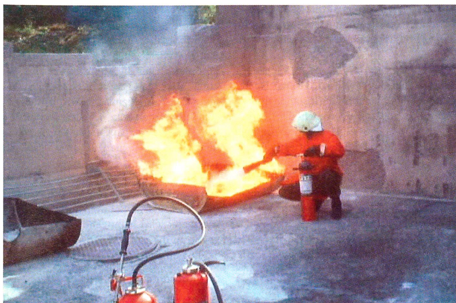
Betriebsoldaten werden in Brandschutz und Brandbekämpfung ausgebildet.

Der Hygienesoldat hat eine vielseitige Aufgabe und er muss flexibel sein. Die Armee verfügt über Desinfektions- und Sterilisationsanhänger, die mobil eingesetzt werden können, wenn grosse Desinfektionen notwendig werden. So zum Beispiel im Katastrophenfall, wenn sehr viele Instru-