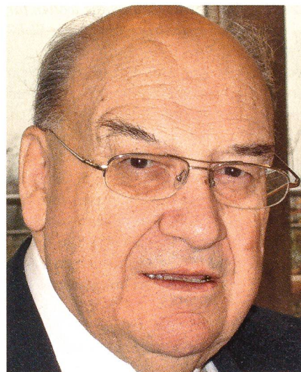
Mühlemann: «Walter handelte weise.»

Dennoch erzielte Walter im ersten Wahlgang 109 Stimmen. Das absolute Mehr betrug 121 Stimmen. Maurer kam auf 67 Stimmen, Ex-Bundesrat Christoph Blocher auf 54. Zählt man Maurers und Blochers Stimmen zusammen, kommt man genau auf das absolute Mehr. Im zweiten Durchgang verfehlte Walter bei einem absoluten Mehr von 122 die Wahl mit 121 Stimmen um eine