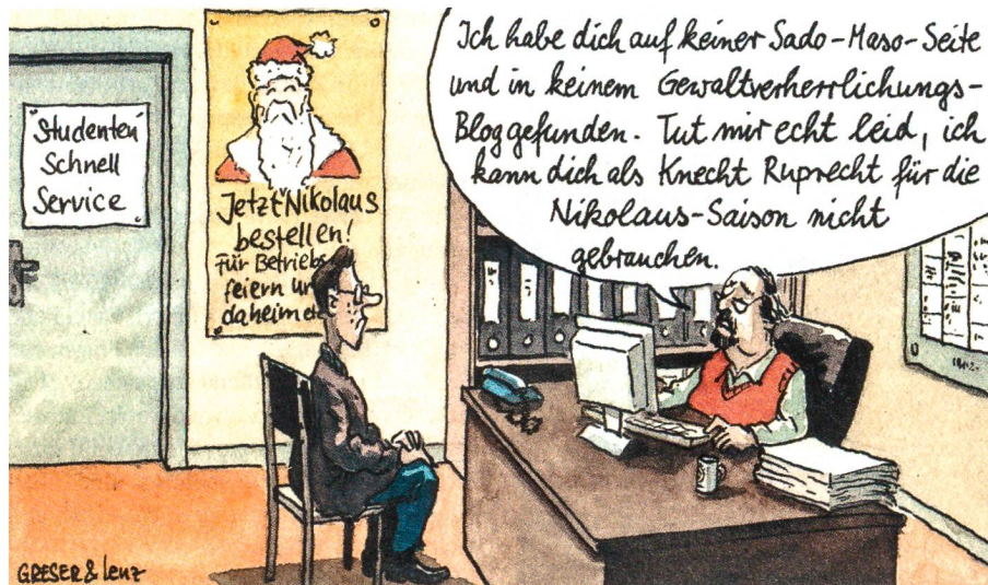
Chefs schnüffeln vermehrt im Internet über Job-Bewerber.