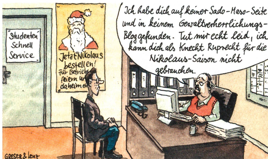
Chefs schnüffeln vermehrt im Internet über Job-Bewerber.