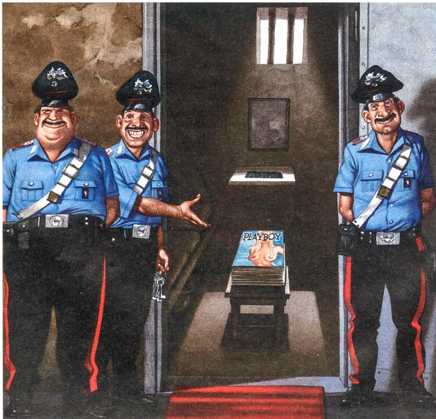
Warten auf Berlusconi.