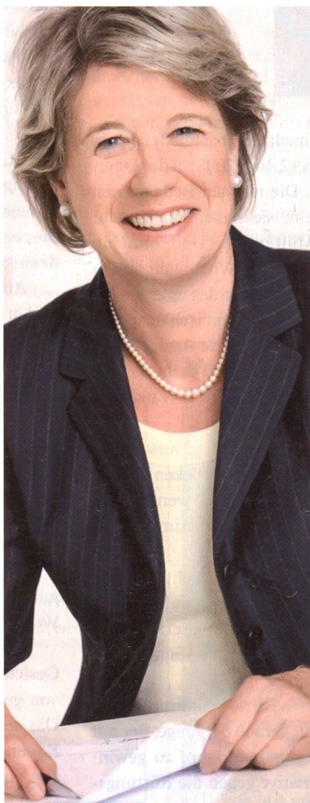
Nationalrätin Corina Eichenberger.

Der Bundesrat empfiehlt dem Parlament, die unsere Wirtschaft schädigende Ini-