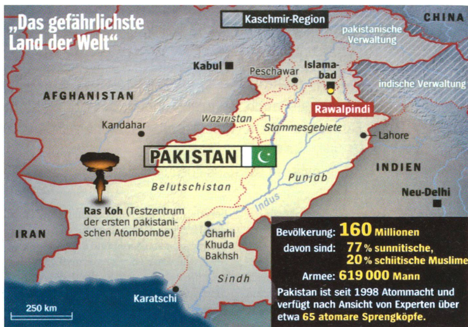
Pakistan – «Das gefährlichste Land der Welt».

Das Bündel zumeist langfristiger Herausforderungen kann in Prozesse gegliedert und mit einigen Beispielen konkretisiert werden. Jene sind bestimmend für die weitere sicherheitspolitische Entwicklung des Landes und deshalb zur Abschätzung