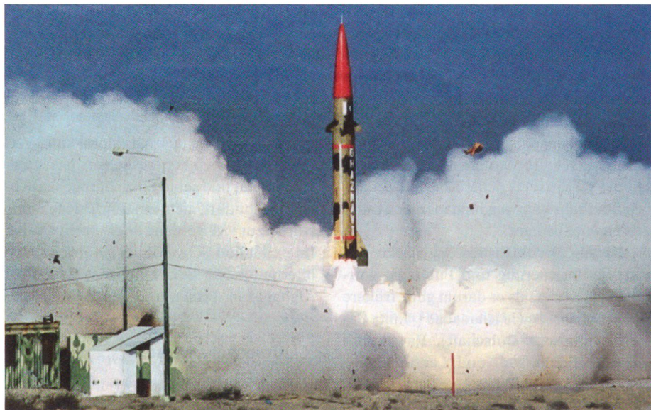
Test einer atomwaffenfähigen Rakete.