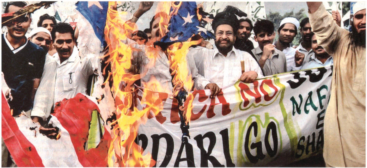
Proteste in Lahore gegen US-Operationen.

tribal areas would be maintained at all cost...». Gleichentags stellte aber der Führer der militanten «Tehrik-e-Taliban Pakistan» Baitullah Mehsud der in der Nordwestprovinz die Koalition anführenden «Awami National Party» ein Ultimatum zum Rücktritt, weil diese offenbar die Abmachungen gemäss Friedensabkommen (21. Mai: Swat) nicht eingehalten habe.