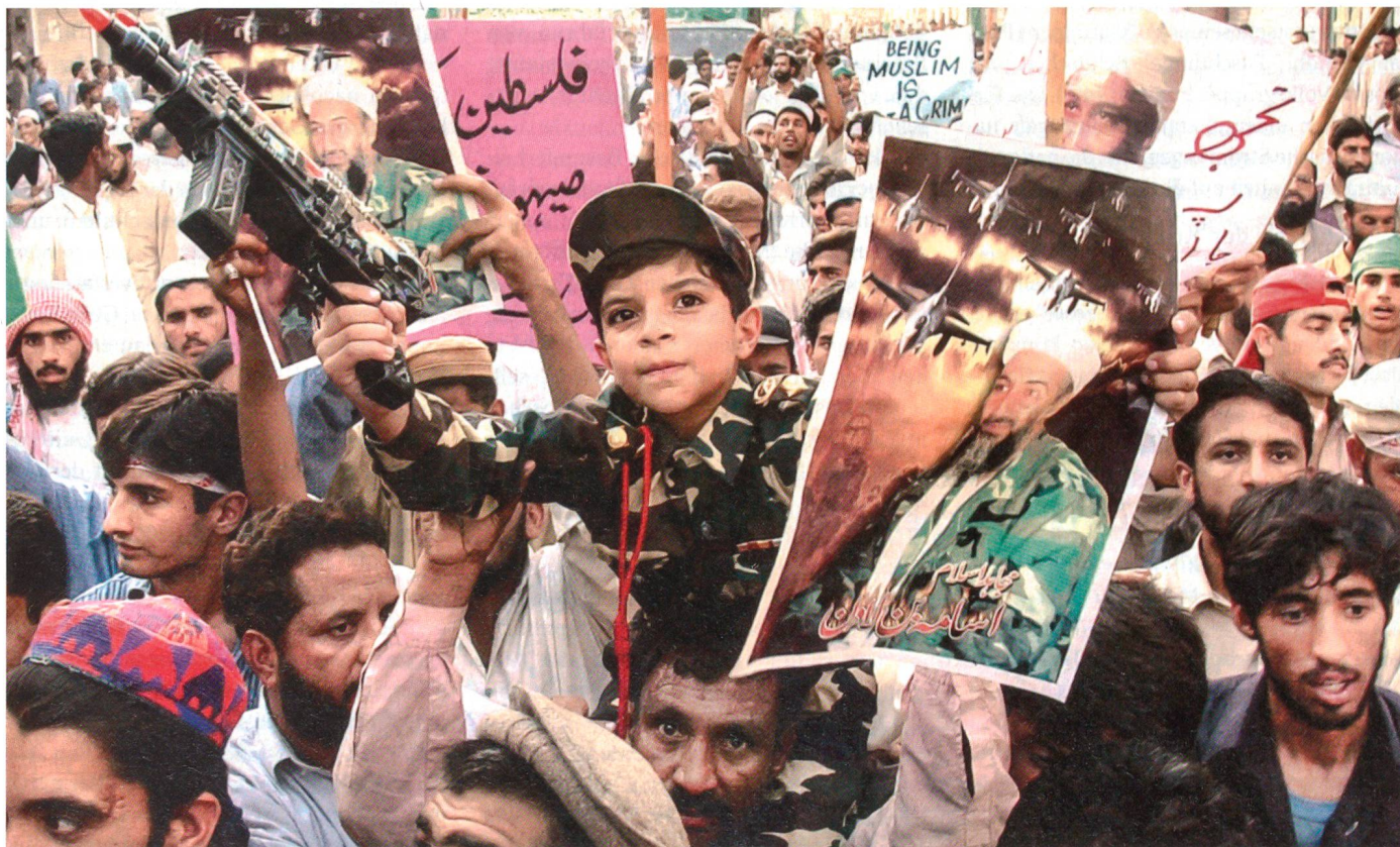
Anhänger Bin Ladens bei einer Demonstration in Rawalpindi.

– sein Grenzumfang von 7820 km (CH: ca 1600 km) mit Grenzen zu 4 unabhängigen, aber auch problembeladenen Nachbarn (Indien: 2912 km; Afghanistan: 2430 km; Iran: 909 km; China: 523 km; Küste: 1046 km). Daraus ergibt sich ein strategischer Interessenlinienverlauf durch Pakistan hindurch, woraus Ansprüche und Ambitionen erwachsen, die mit Pakistan teilweise kollidieren;