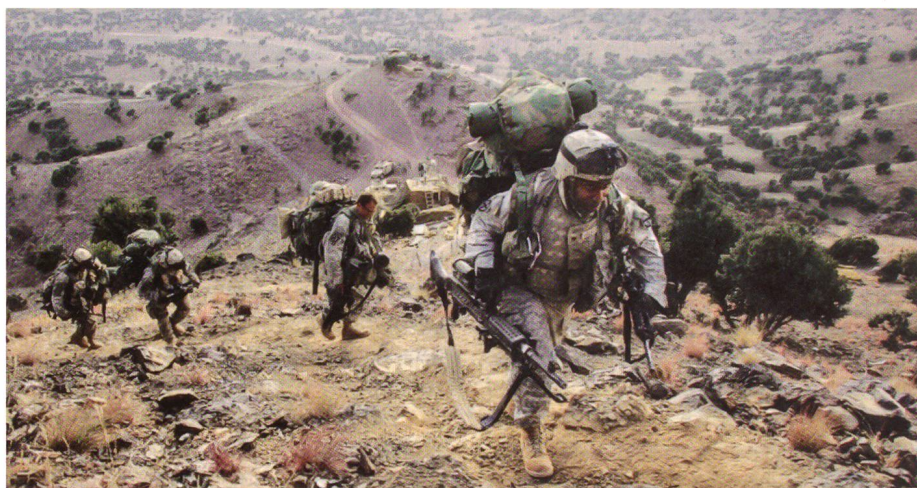
US-Anti-Terror-Einheiten im afghanisch-pakistanischen Grenzgebiet.

Sie verlangen die strikte, absolute und unbestrittene Beachtung der Scharia und Sunnah. Für viele gemässigte Muslime liegt die Grenze im praktischen Alltag, das heisst etwa dort, wo es um das Rasierverbot von Bärten, das Verbot von klassischer und an-